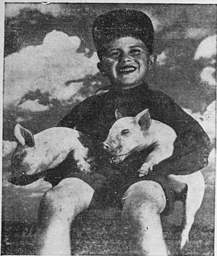
CULTIVATEURS canadiens, si vous voulez conserver le marché anglais pour votre bœuf, répondez à la demande toujours croissante de lard sur votre marché local, soignez bien vos jeunes porcs. Le soin des porcelets, dit le Ministre fédéral de l'Agriculture, commence avec la mère, qui doit être bien nourrie avant et après la mise bas, pour produire des petits vigoureux. Il faut aussi fournir du fer aux gorets pendant qu'ils têtent, les nourrir séparément dans un coin du parquet, et leur donner une quantité généreuse de substances minérales et d'aliments qui stimulent la croissance. Les porcs qui paient sont les sujets sains et vigoureux.