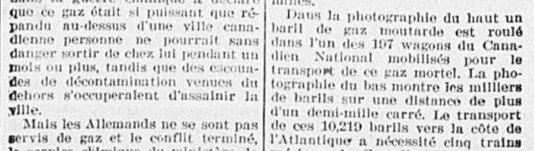
la Défense nationale dut trouver le moyen de disposer sans danger de ces gaz mortels. Il fut décidé que la façon la plus sûre et la plus efficace était de les jeter à la mer.