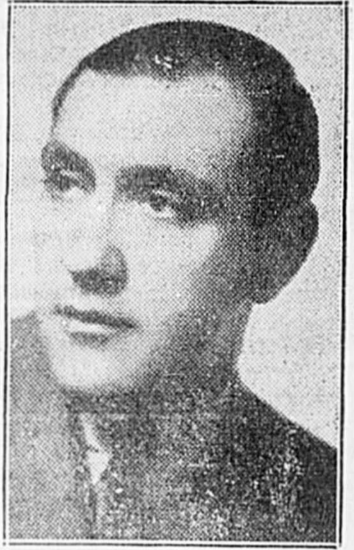
Gregor PLATIGORSKY "le plus grand violoncelliste au monde" suivant l'opinion de Koussevitsky chef d'orchestre de Boston, qui donnera le deuxième récital de la saison des Concerts de Shawinigan et Grand-Mère à la salle du poste no 1, 5me Rue, mardi soir le 14 janvier à 8.30 heures p.m.

guerre; des traîtres devant le pot de confitures et les hommes d'honneur au poteau!