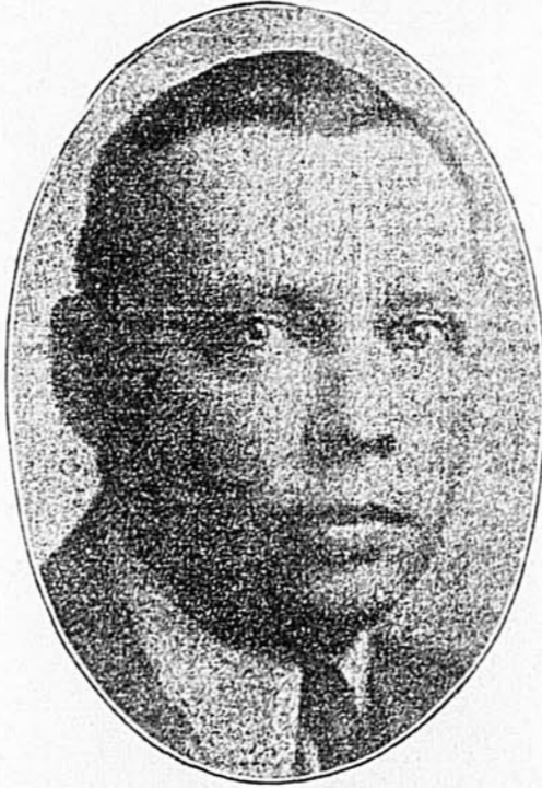
J.-L. BOULANGER Sous-Ministre

Aujourd'hui, grâce à la politique des bons chemins, inaugurée en 1912, et continuée depuis ce temps, la situation de nos cultivateurs n'est plus la même. Ils ont à leur disposition pour entretenir leurs relations sociales et économiques, proches ou lointaines, un réseau routier qui a des ramifications dans les régions les plus éloignées de chez nous. A ce point de vue, ils sont beaucoup mieux desservis que les cultivateurs de la province voisine dont la voirie a un caractère plus touristique qu'agricole. Chez nous les routes ont été construites pour les cultivateurs et nous pourrions ajouter sans manquer à la vérité par les cultivateurs, puisque ceux-ci ont travaillé en très grand nombre à la construction des routes et ont largement profité des sommes énormes que le gouvernement a consacrées au paiement des ouvriers de notre voirie.