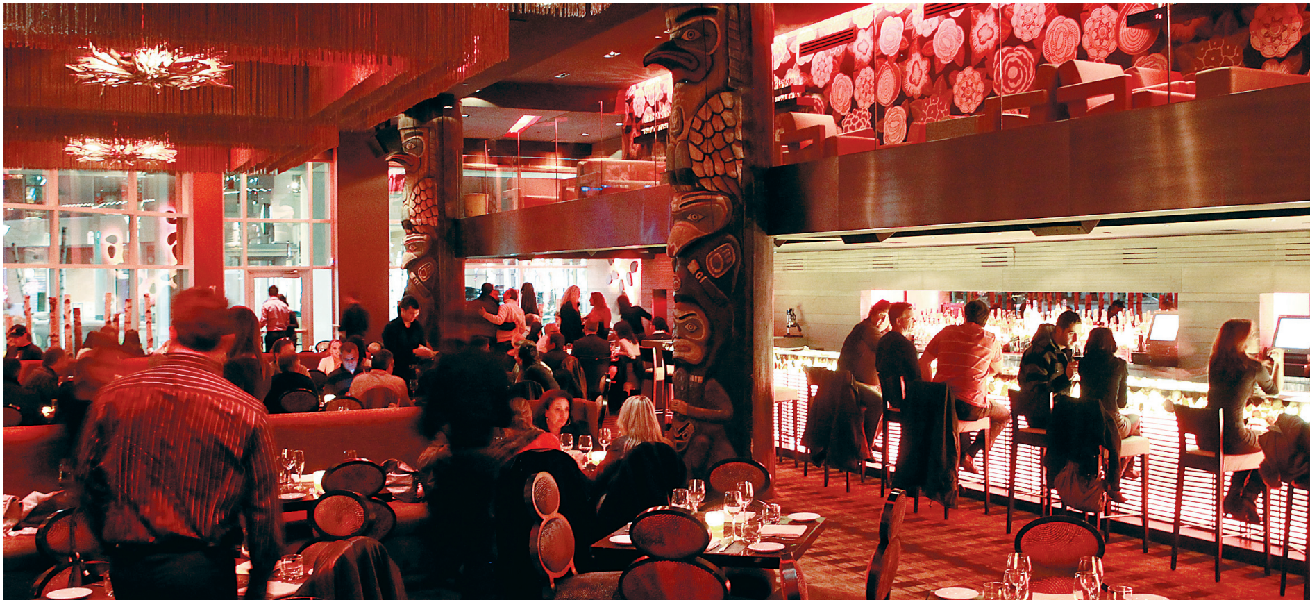
Le décor du restaurant bar Kabana de Brossard est à l'image du centre commercial du quartier Dix30: moderne et flamboyant.

Sherbrooke peut être fière de disposer de bonnes tables comme le célèbre restaurant de Danny St-Pierre, Auguste, tenu par un jeune couple dédié à la cause de la gastronomie. Pour des plats simples et de saison, comme la soupe de courge, les mijotés et le pudding à l'érable, une petite merveille de saveurs et de plaisir.