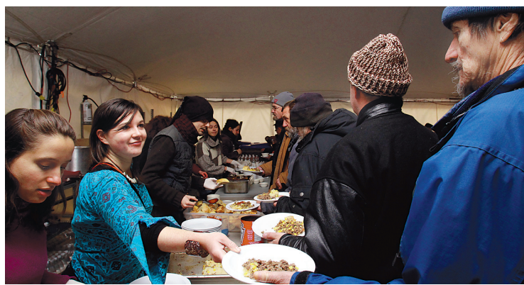
Des repas sont offerts aux itinérants pendant le week-end.