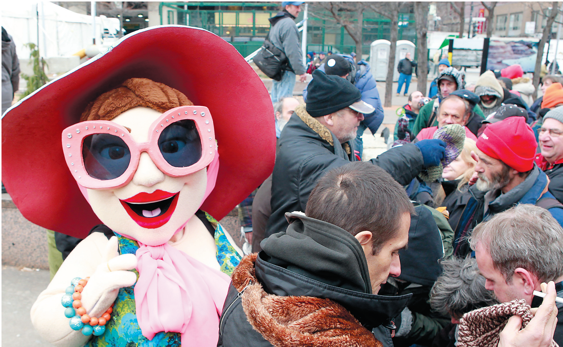
La mascotte de l'événement État d'urgence , qui se tient jusqu'à dimanche à Montréal.