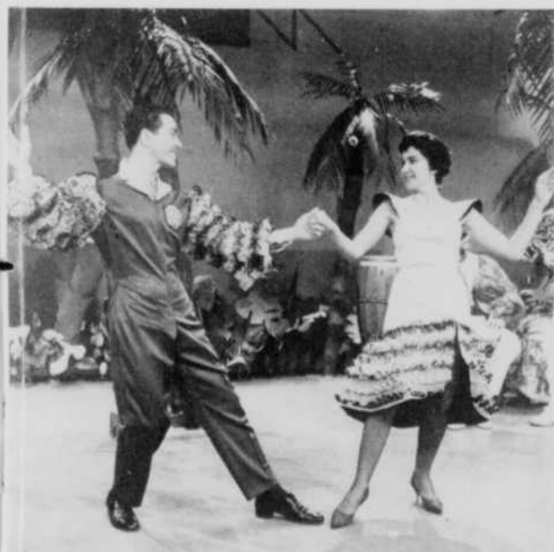
Dans un décor exotique approprié, deux danseurs donnent l'illusion de l'Amérique latine. C'est Fiesta Tropicana , l'une des nombreuses émissions de variétés du poste CFCM-TV.

Mais ce problème majeur se retrouve dans tous les centres de télévision. Nous verrons, la semaine prochaine, en quels termes ce problème se pose pour les dirigeants du poste CJBR-TV, à Rimouski.