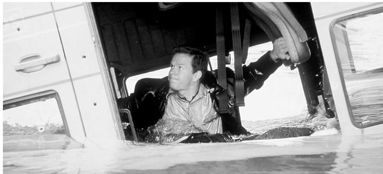
Mark Wahlberg tente de se tirer de la flotte, dans une scène de The Italian Job .

Un film de genre dont l'approche se révèle particulièrement rafraîchissante.