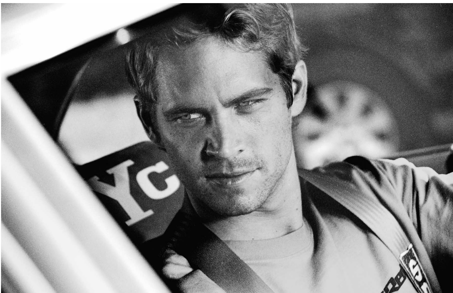
L'acteur américain Paul Walker est devenu une vedette grâce au « film de chars » The Fast and the Furious . Il est lui-même un grand amateur de courses et de voitures, et ses admirateurs le retrouveront dans 2 Fast 2 Furious .

« Je leur en ai parlé mais je n'ai pas tenté de les convaincre, précise Walker. Je préfère, de toute façon, laisser les gens libres de prendre leurs propres décisions. Qui en est essentiellement une d'affaires ici. L'un et l'autre ne voyaient ni l'urgence ni la nécessité d'élaborer une suite. Quant à Vin, ce n'est un secret pour personne que ce gars-là est présentement en mission. Il prend son métier très au sérieux.