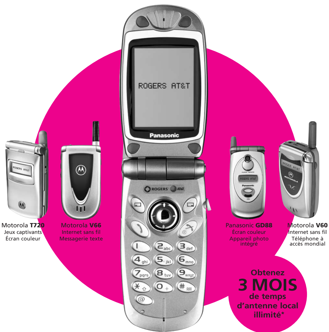
Motorola T720 Jeux captivants Écran couleur

On enlève 100$ à tous nos téléphones flips*.