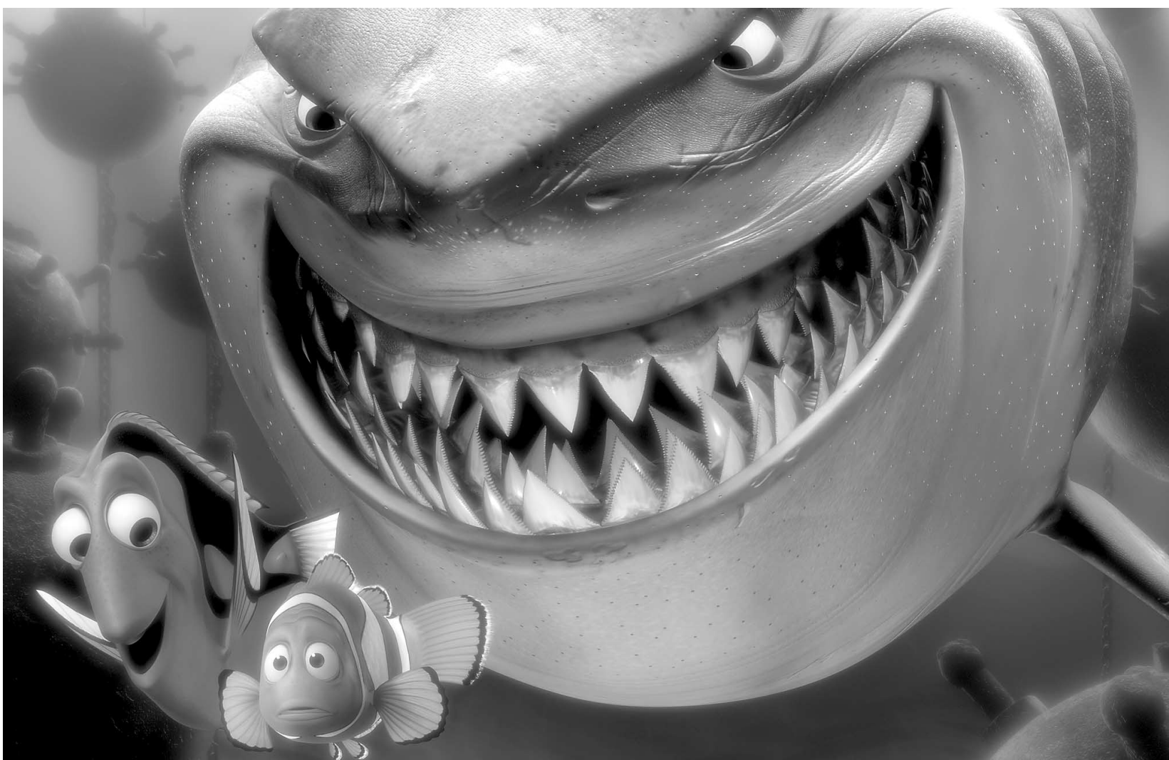
Le nouveau film d'animation de Pixar se distingue par une qualité d'image extraordinaire, un exploit d'autant plus remarquable que 95 % du film se déroule dans les milieux sous-marins.

Sur un fond tragique (un papa poisson clown part à la recherche de son fils qui a été capturé par un plongeur), on nous propose ici une fantaisie pleine de couleurs et d'envoies pétillantes. À cet égard, on retient bien entendu le personnage de Doris (à qui Ellen DeGeneres prête sa voix — c'est Anne Dorval qui prend la relève dans la version française), un poisson femelle aux prises avec d'importants troubles de mémoire. L'humoriste s'en donne en effet à coeur joie en dotant ce personnage, qui accompagne le