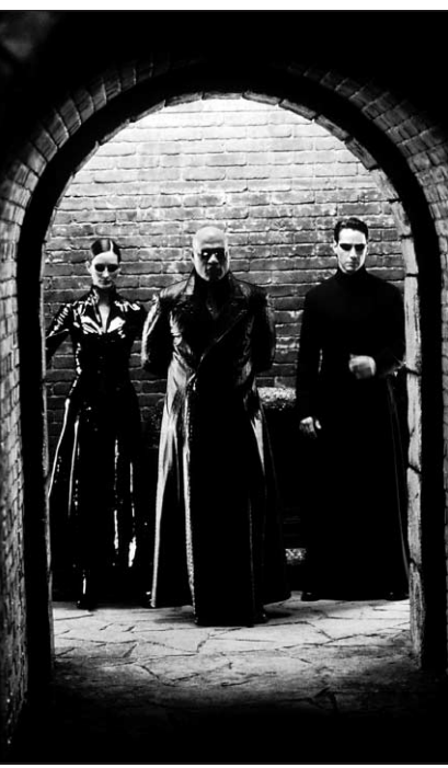
Reloaded est présenté dans des salles où seulement 40 % de l'auditoire est composé de femmes, selon le distributeur, Warner Brothers.

Les frères Wachowski « ne vous demandent pas d'être une seule chose », dit-elle. « Vous pouvez être forte et intelligente et belle. Je pense que le film fonctionne à plusieurs niveaux parce que les personnages le font aussi. Voilà pourquoi le film a une signification autant pour les femmes que les hommes. »