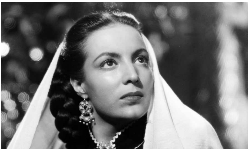
L'actrice mexicaine Maria Félix dans Enamorada , d'Emilio Fernandez.

AU RAYON des disparus de l'année, 2002 restera pour le Québec artistique celle de la disparition de Jean-Paul Riopelle. Au Mexique, ce ne sont pas une, mais deux morts de figures légendaires qui ont endeuillé le pays : le photographe centenaire Manuel Alvarez Bravo et l'actrice Maria Félix.