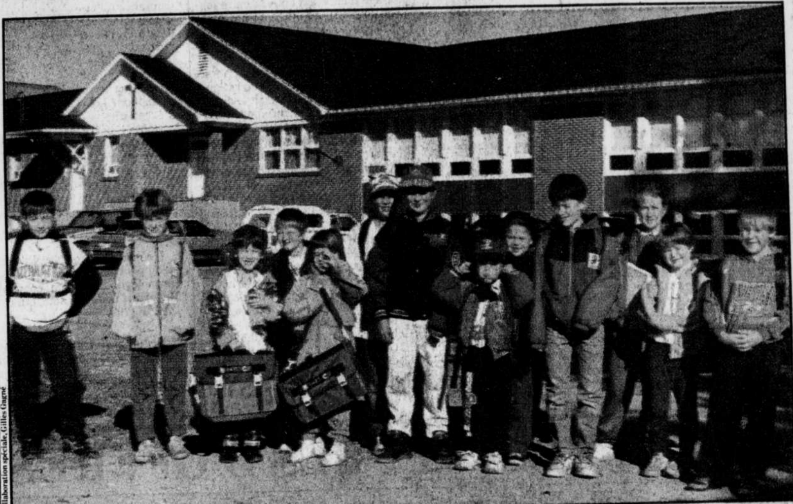
L'arrivée à l'école de Saint-Elzéar. Il faut prévoir une chaude lutte de la part des parents pour sauver cette école menacée de fermeture en 1996-1997.