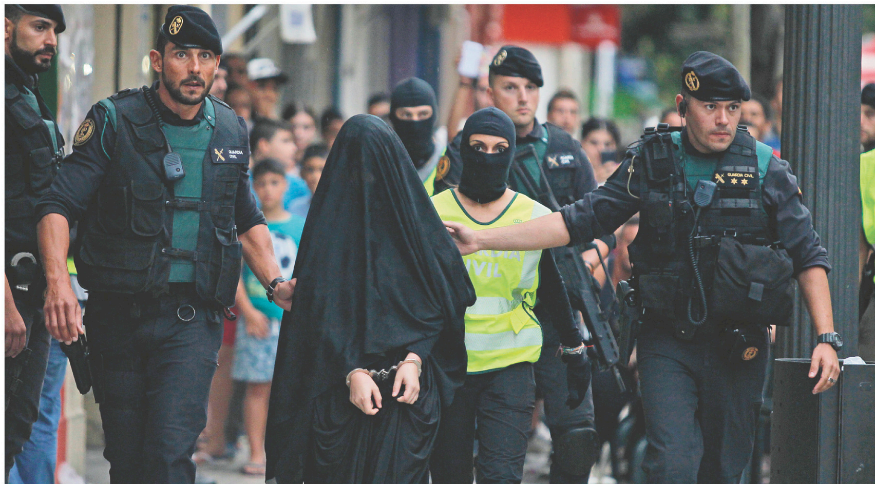
Les femmes enrôlées par le groupe EI servent principalement à faire des enfants et à recruter d'autres femmes sur les réseaux sociaux. Ci-dessus, une Espagnole de 18 ans est arrêtée, en septembre 2015, pour avoir fait du recrutement sur Internet.