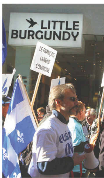
Une manifestation pour l'affichage en français, à Montréal