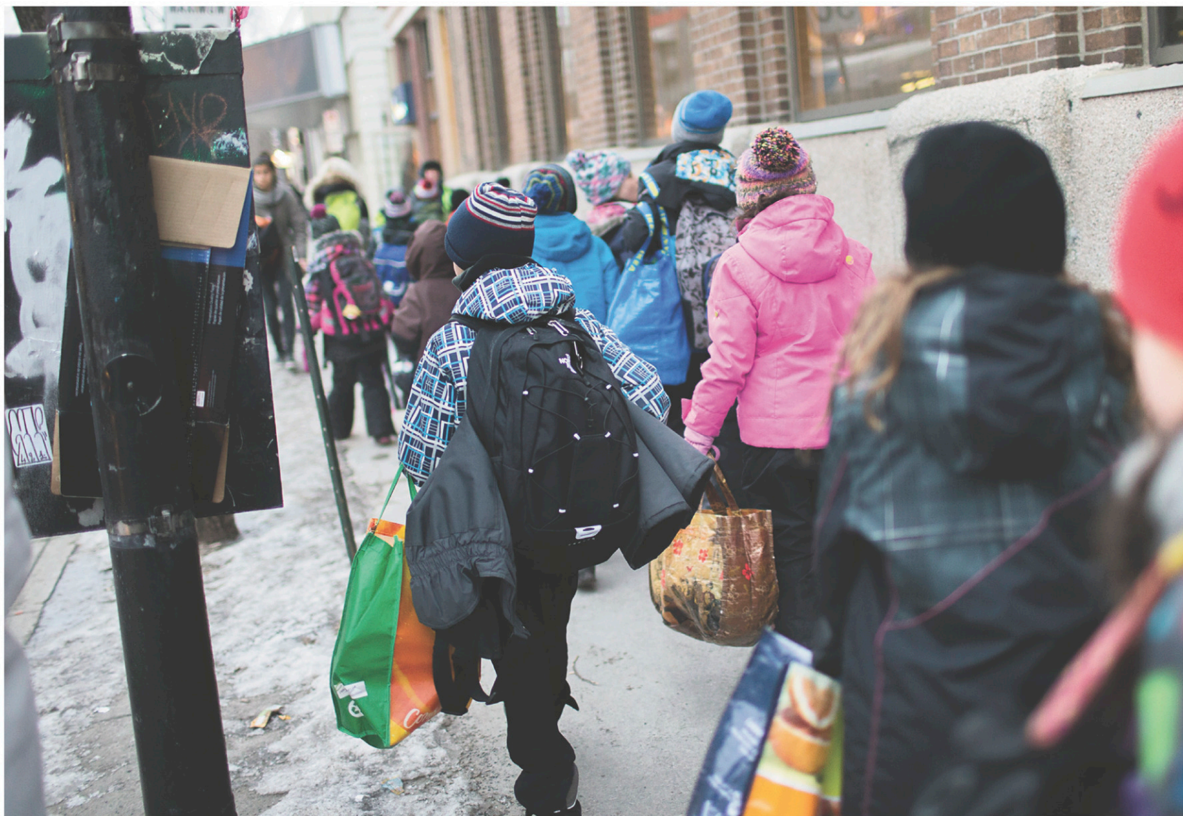
Quelque 600 élèves de la CSDM seront renvoyés vers leur école de quartier à l'automne.

Cette situation crée beaucoup de « mécontentement » chez les parents directement concernés par cette relocalisation forcée, constate Eve Kirlin, présidente du comité de