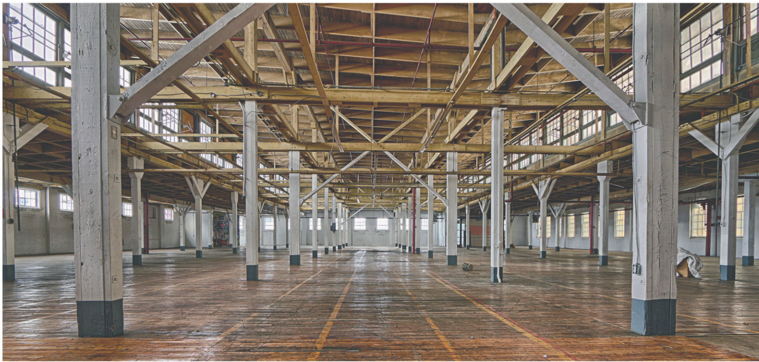
L'ancienne usine de munitions datant de la Seconde Guerre mondiale fera place à un stationnement pour les camions de la Ville.