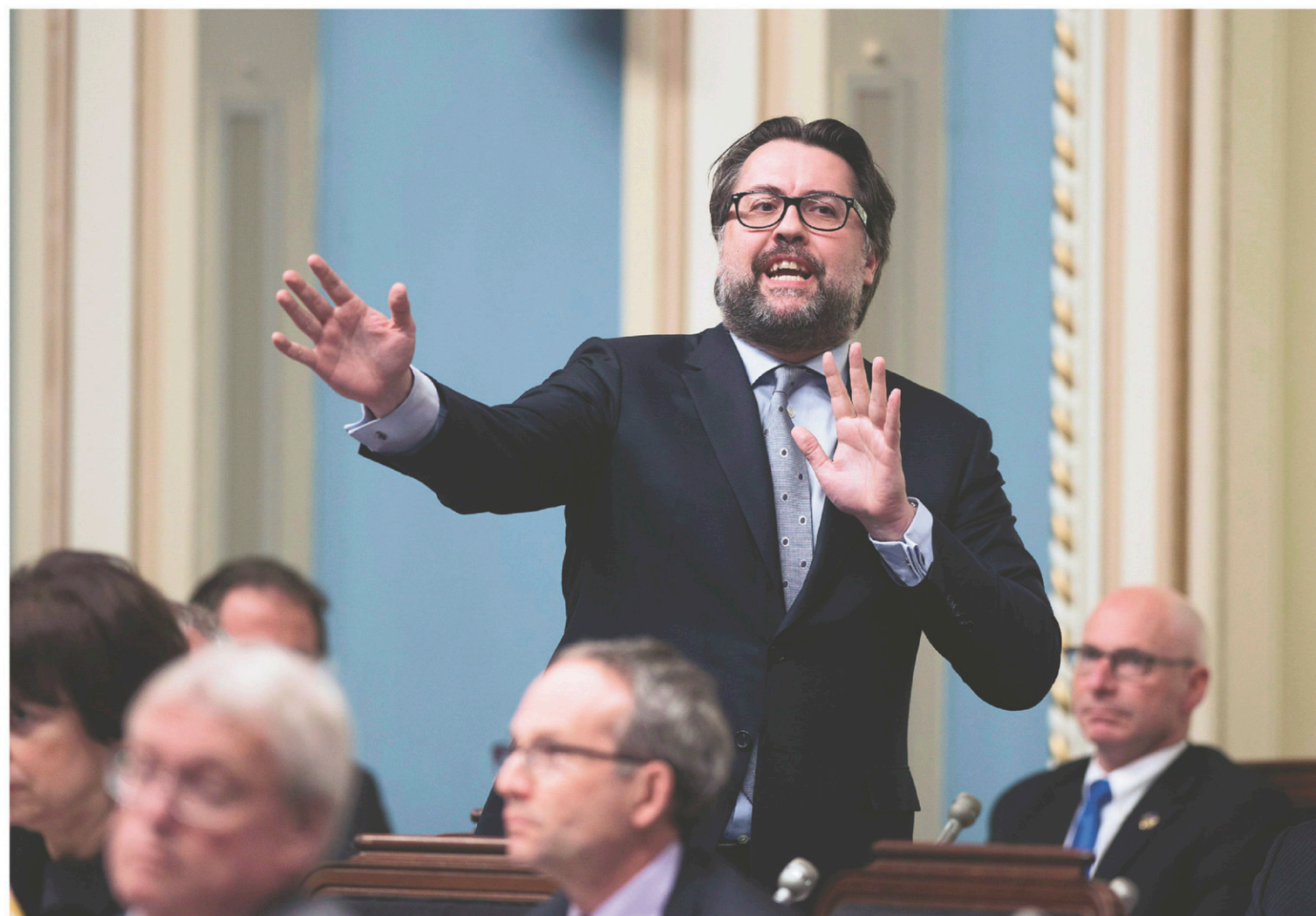
Le ministre de l'Environnement, David Heurtel, rejette les allégations de la CAQ.