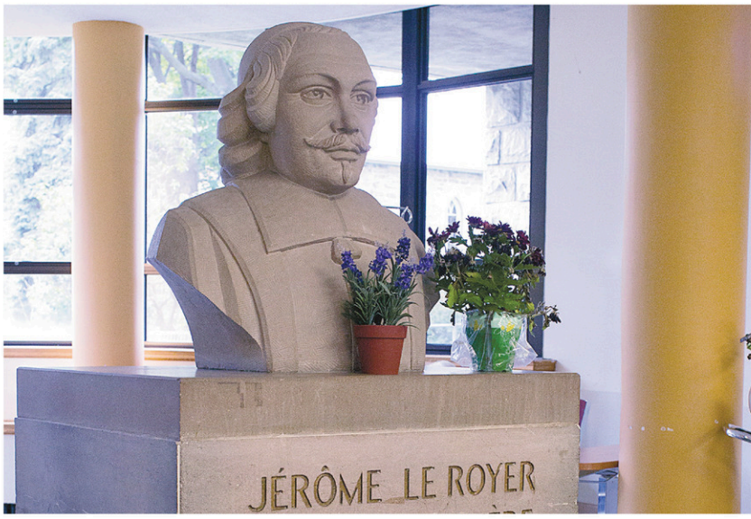
Une statue de Jérôme Le Royer à l'Hôtel-Dieu de Montréal, dont il a fondé l'organisation administrative, les Hospitalières de La Flèche.