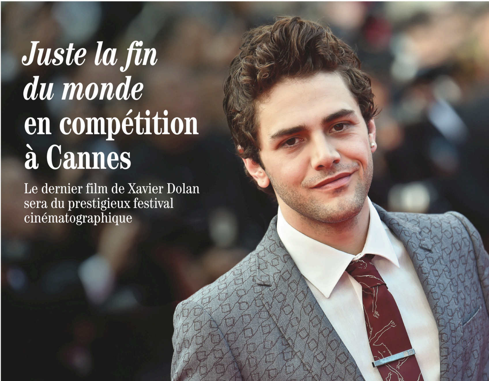
BERTRAND LANGLOIS AGENCE FRANCE-PRESSE

Le dernier film de Xavier Dolan sera du prestigieux festival cinématographique