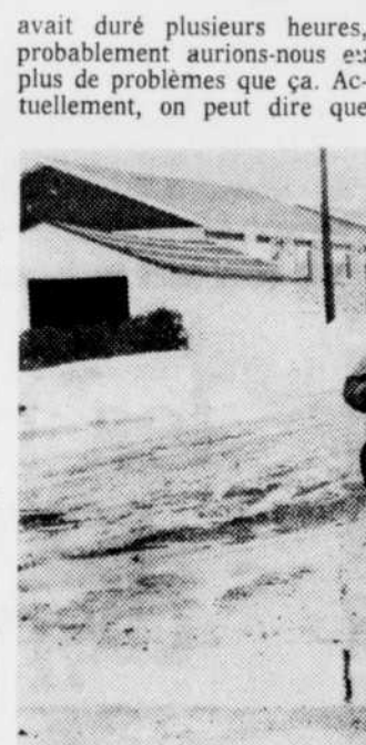
Les employés municipaux "ébouillantent" ici les bouches d'égout pour permettre l'écoulement des eaux en provenance de la neige fondue dans la ville de Thetford. Jusqu'ici la cité n'aurait pas été confrontée avec de sérieux problèmes...

THETFORD MINES, (YP) — La région de l'amiante n'a pas été trop touchée par la fonte soudaine des deux derniers jours, à aucune route n'ayant été bloquée suite à de possibles inondations ou des bris de section de chemin. En outre, on ne rapportait pas de problèmes sérieux hier à la cité de Thetford pour ce qui est de la ville elle-même.