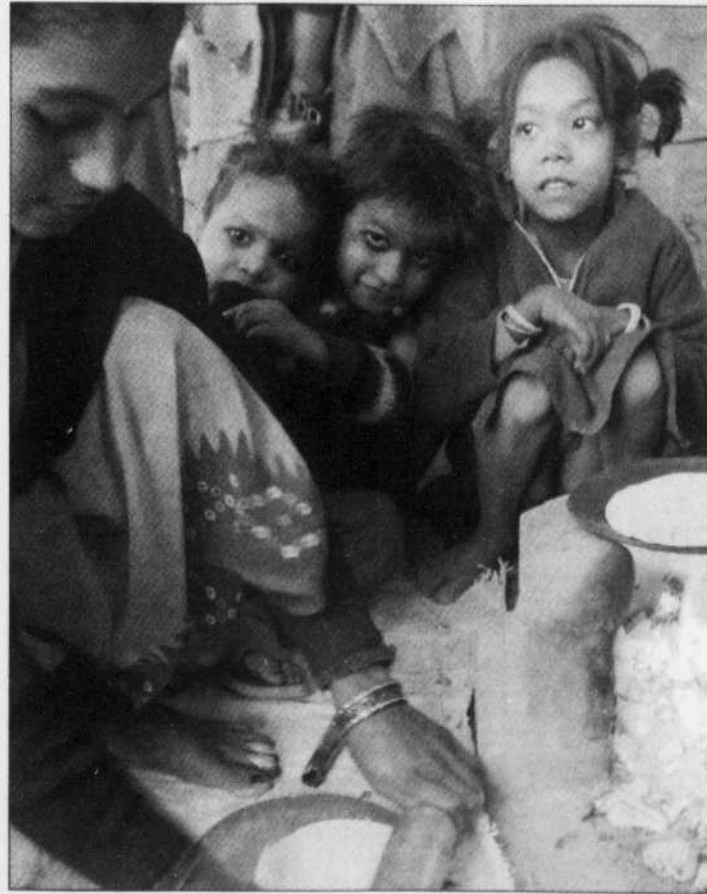
Une femme indienne fait la cuisine pour nourrir de jeunes enfants sans domicile.

Le nombre d'enfants soldats a diminué au cours des dernières années, se réjouit par ailleurs l'UNICEF, qui note toutefois que le taux de mortalité infantile est particulièrement élevé dans les pays qui ont connu des conflits, ce qui s'explique par la destruction des infrastructures sanitaires.