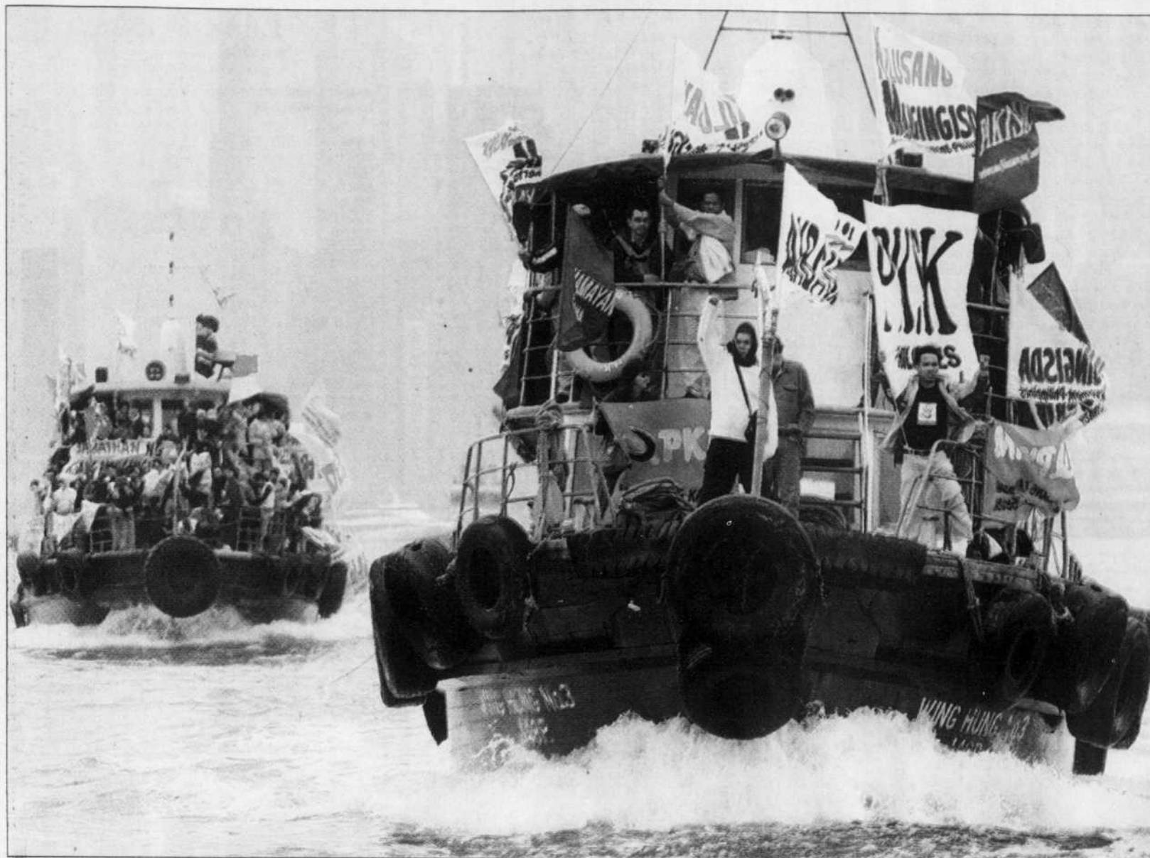
Les policiers étant bien présents sur la terre ferme, certains manifestants ont choisi hier la voie des mers pour démontrer leur opposition à l'OMC, dont la conférence s'ouvrait hier à Hong Kong.