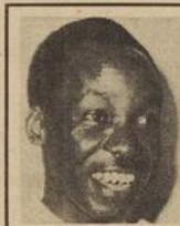
Novembre Tanganyika Population : 9 millions Premier ministre : Julius Nyerere