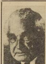
6 août Jamaïque Pop.: 2 millions Premier ministre : Bustamante

1er juillet Ruanda Pop.: 3 millions Président : M. Kayibanda