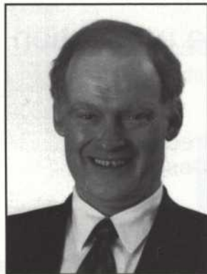
Photo de Louise Portal

A u terme d'une saison exceptionnelle à plus d'un égard, le Théâtre d'Aujourd'hui a su nous proposer cette année une autre formule attrayante et imaginative pour sa soirée-bénéfice, celle d'un Cabaret-bénéfice.