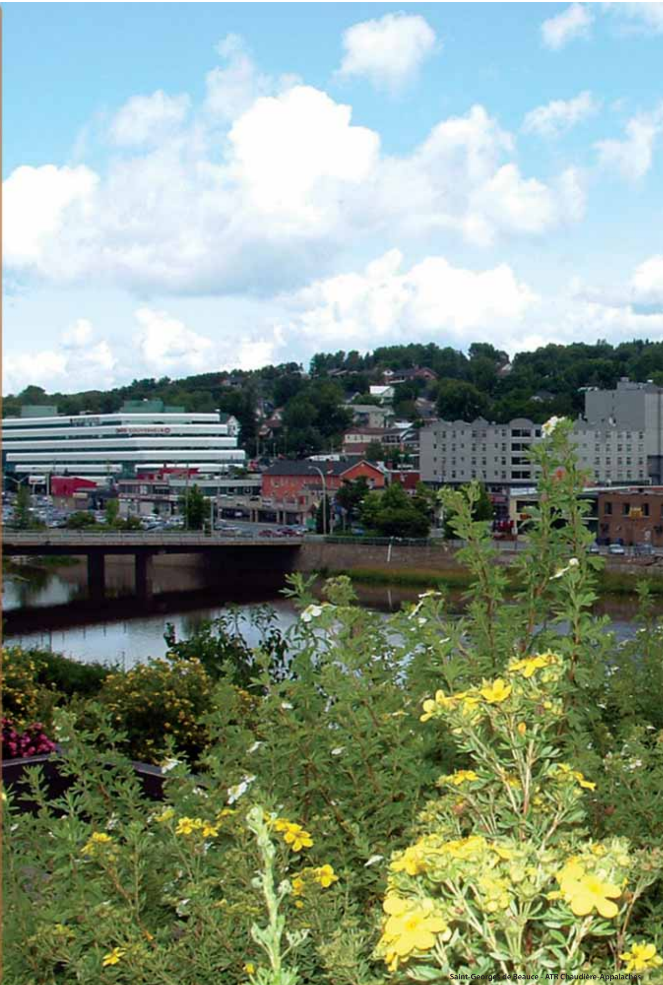
Saint-Georges-de-Beauce - ATR Chaudière-Appalaches