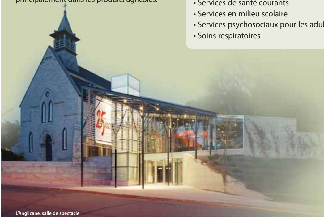
L'Anglicane, salle de spectacle