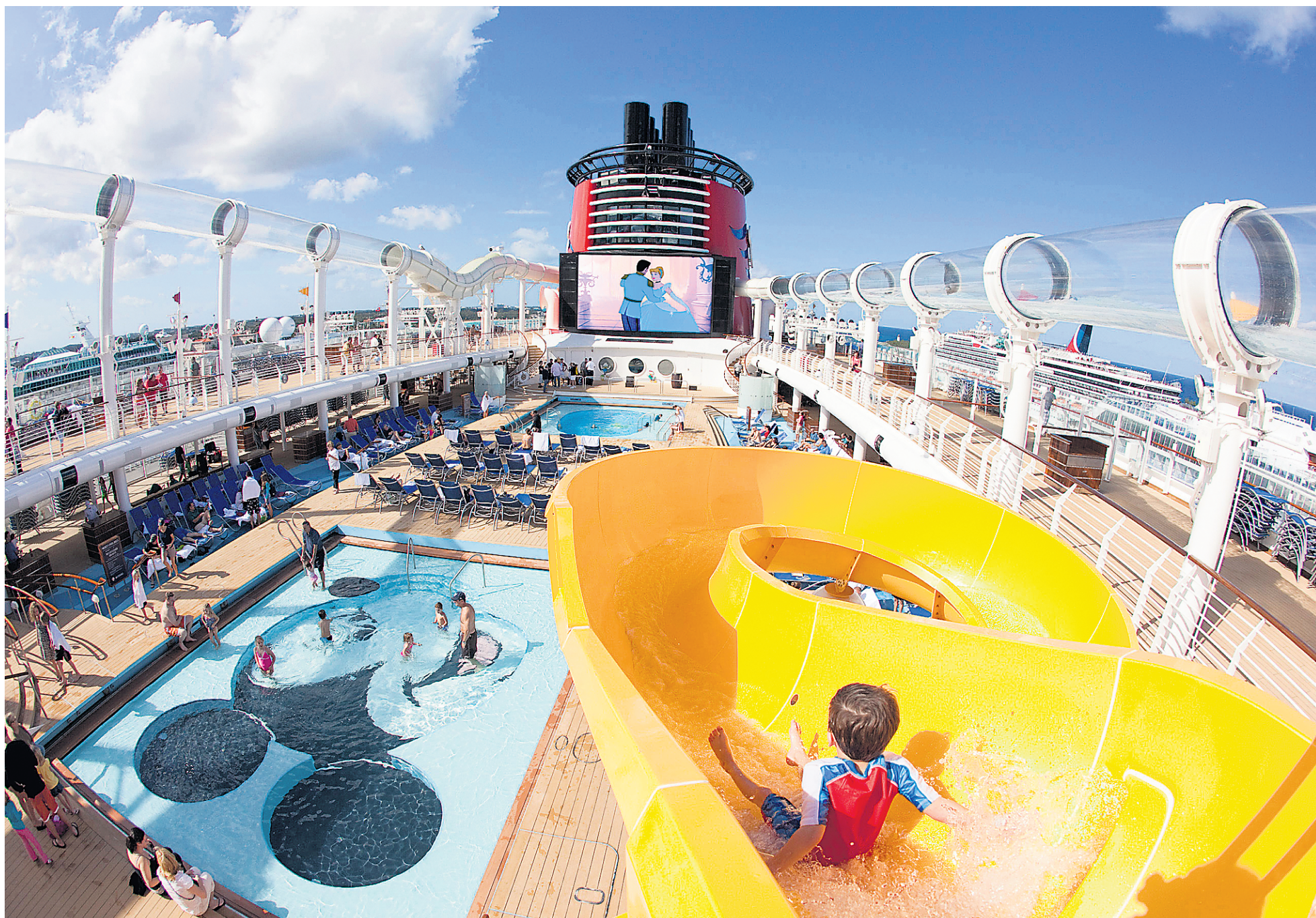
Disney est une valeur sûre pour les croisières familiales. On propose souvent des itinéraires de trois ou quatre jours, combinés avec un séjour à Disney World.