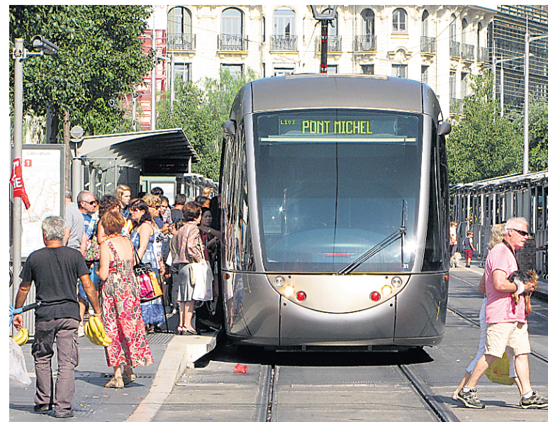
Le tramway, ultramoderne et fort achalandé, est en service depuis cinq ans.