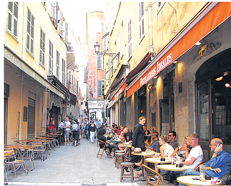
Cafés, restos et boutiques se côtoient dans les rues du Vieux-Nice.