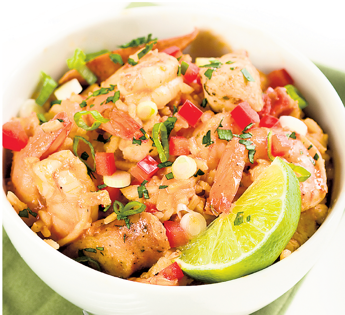
Ce plat aux accents créoles, le jambalaya, est un des mets les mieux ancrés dans la gastronomie louisianaise.

On entend souvent dire que La Nouvelle-Orléans est l'expression même du gumbo : un mélange de cultures, de couleurs et de saveurs. Le gumbo tire son nom de la plante africaine du même nom, qui sert à épaissir le ragoût. Il est composé de riz et de tomates — héritages des Espagnols —, d'une sauce brune plus