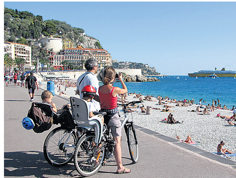
Un dimanche d'octobre à Nice. On se croirait en plein été...