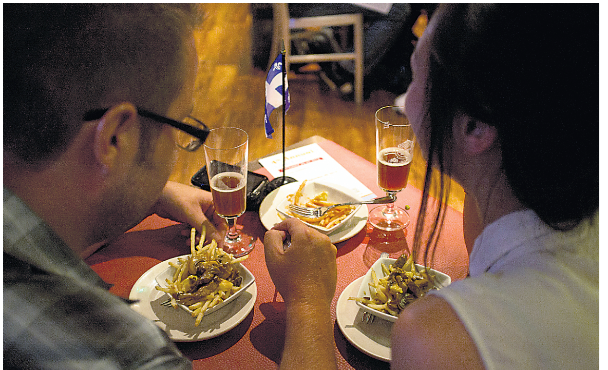
Le bistro est à la fois un lieu de rencontre pour des Québécois en mal du pays et une occasion pour des Américains de découvrir un type de cuisine qui reste encore méconnu.

1386, Westwood Blvd., 310 441-5384, soleilwestwood.com