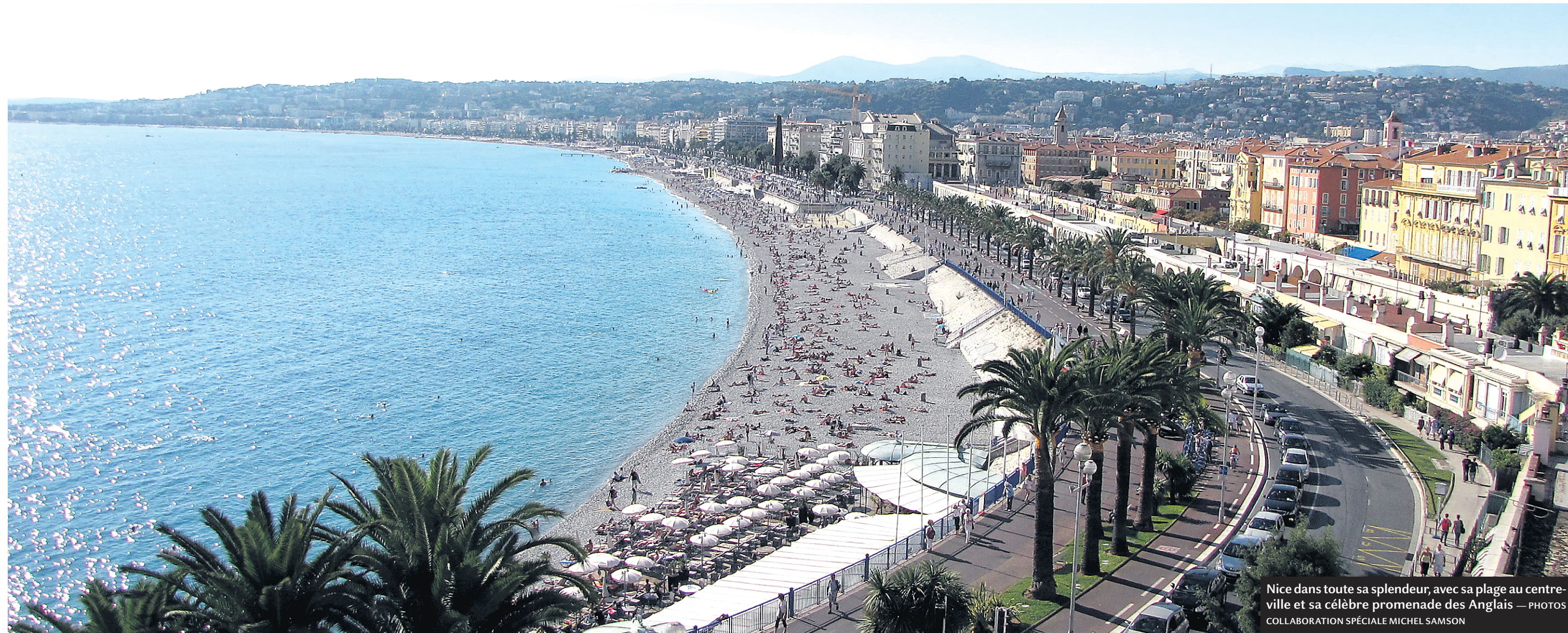
Nice dans toute sa splendeur, avec sa plage au centre-ville et sa célèbre promenade des Anglais