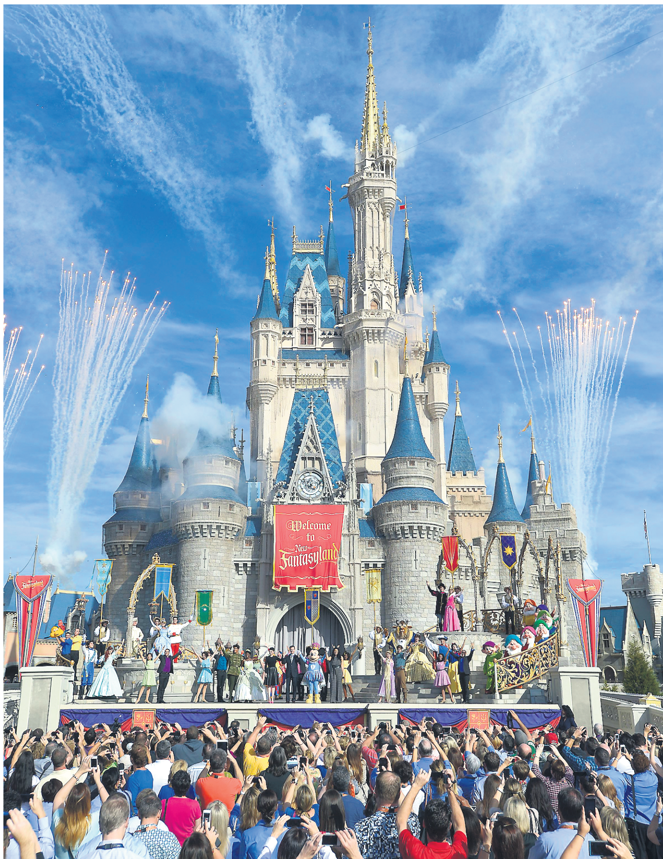
Avec ses nouvelles attractions inspirées des films Dumbo , La Belle et la Bête et La petite sirène , Fantasyland est le plus grand projet d'expansion en 41 ans d'histoire pour le parc d'attractions situé près d'Orlando, en Floride.