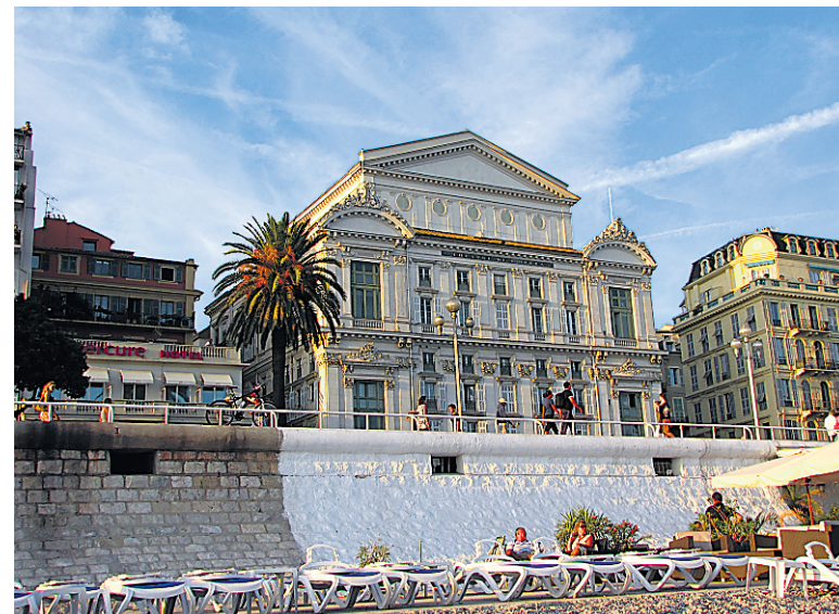
L'Opéra de Nice, monument Belle Époque, construit en 1885