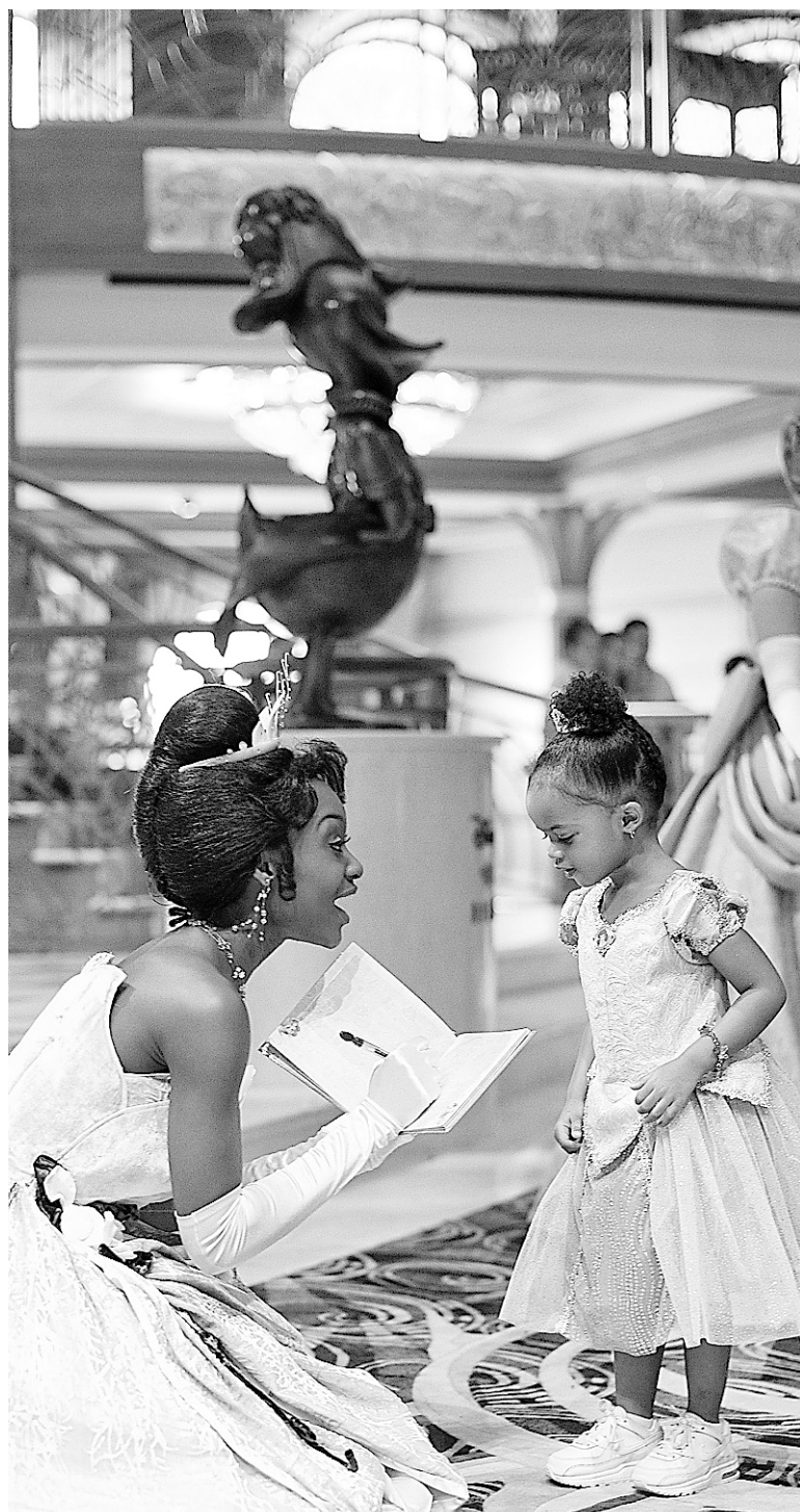
Sur les navires Disney, en plus des activités, les personnages qui ont fait la popularité de la marque sont présents, au grand plaisir des enfants. Seul hic, ces croisières sont assez coûteuses.

Si les bébés sont admis à partir de six mois sur la plupart des navires, c'est toutefois à compter de cinq ou six ans qu'ils commencent à vraiment apprécier cet environnement. À 10 ou 12 ans, plusieurs enfants sont si intéressés par les différentes activités de ne pas passer suffisamment de temps avec eux!