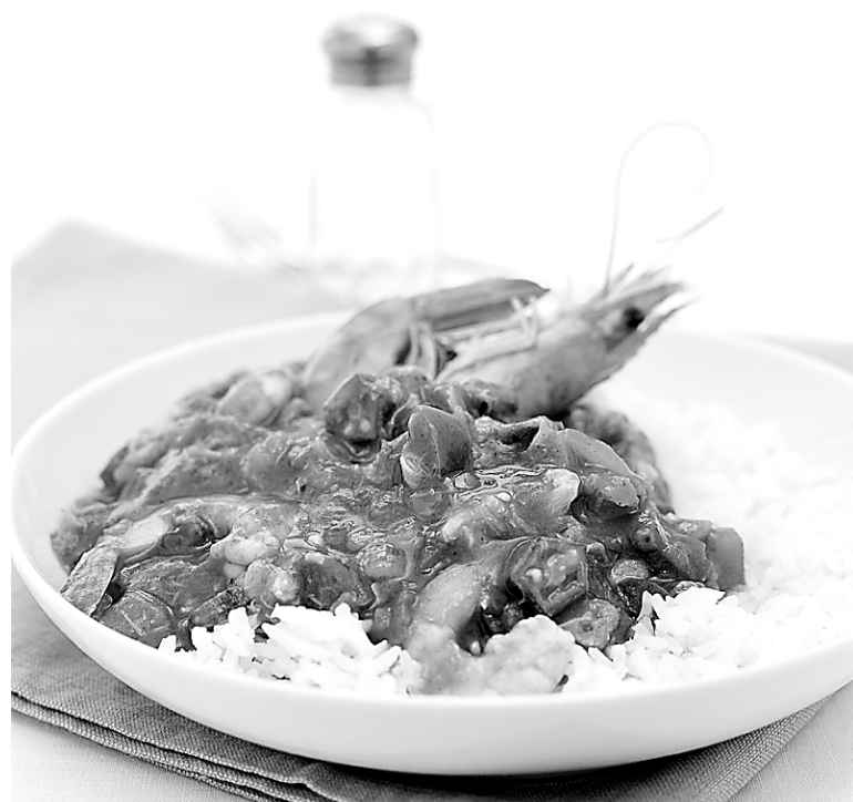
Le gumbo aux crevettes, plat typique de La Nouvelle-Orléans : un vrai mélange de cultures, de couleurs et de saveurs

Et si vous aimez mettre la main à la pâte, enfiler votre toque de cuisinier pour participer aux ateliers de la New Orleans School of Cooking. Dans un ancien entrepôt de mélasse, rénové et transformé en salle de cuisine