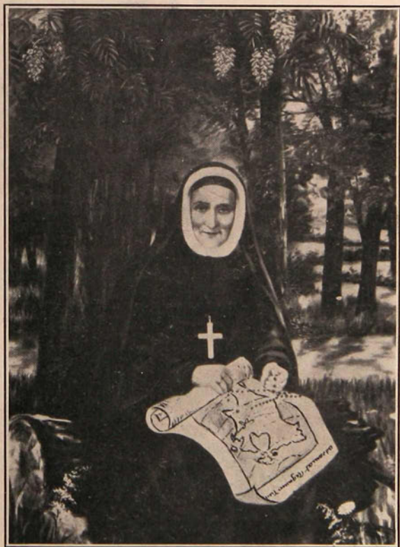
LA VÉNÉRABLE PHILIPPINE DUCHESNE