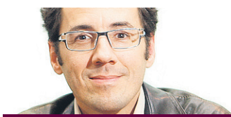
FRANÇOIS CHARTIER COLLABORATION SPÉCIALE HARMONIES

La fin de l'année est la période idéale pour souligner que tous n'ont pas le même accès à l'alimentation quotidienne, tout comme à l'éducation liée aux plaisirs de la table. J'en profite donc pour lever mon chapeau à La Tablée des chefs. Un organisme voué à la cause alimentaire au Québec qui lutte contre la faim en nourrissant les familles dans le besoin et en développant l'autonomie alimentaire des générations futures afin de diminuer leur éventuelle dépendance à l'aide alimentaire.