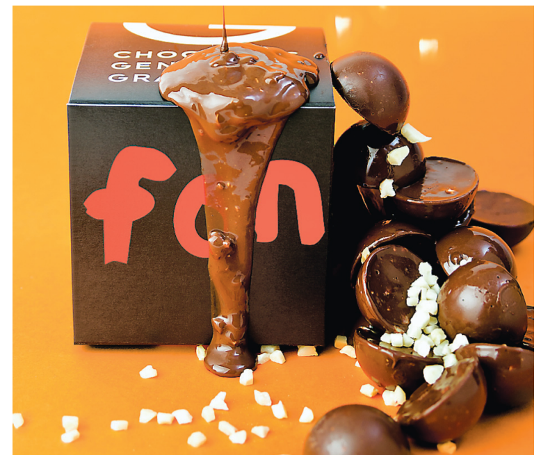
Une fois fondue, dans la collection Souvenirs d'enfance de Geneviève Grandbois.