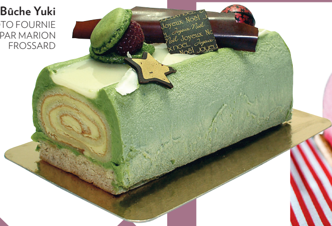
2 Bûche Yuki