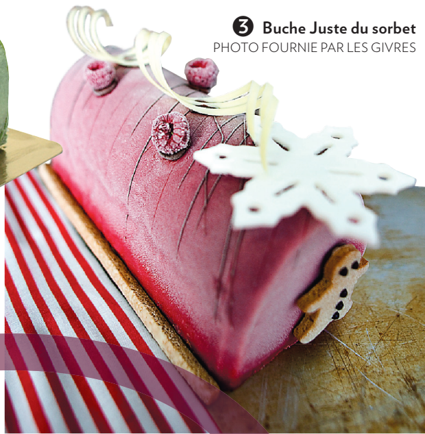
3 Bûche Juste du sorbet