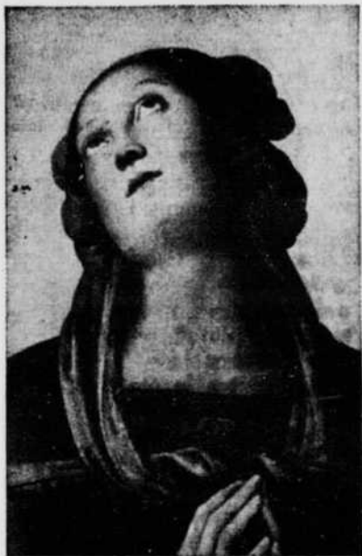
Vierge de l'Assomption par le Pérugin