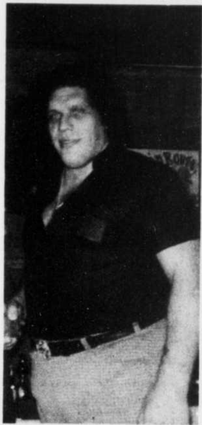
Le géant Ferré

(207 kilos), il a déjà pesé 560 lbs; il rêve de faire descendre la balance à 400 livres, sans se faire trop d'illusion quant aux rôles romantiques qu'on pourrait lui offrir s'il était plus "svelte".