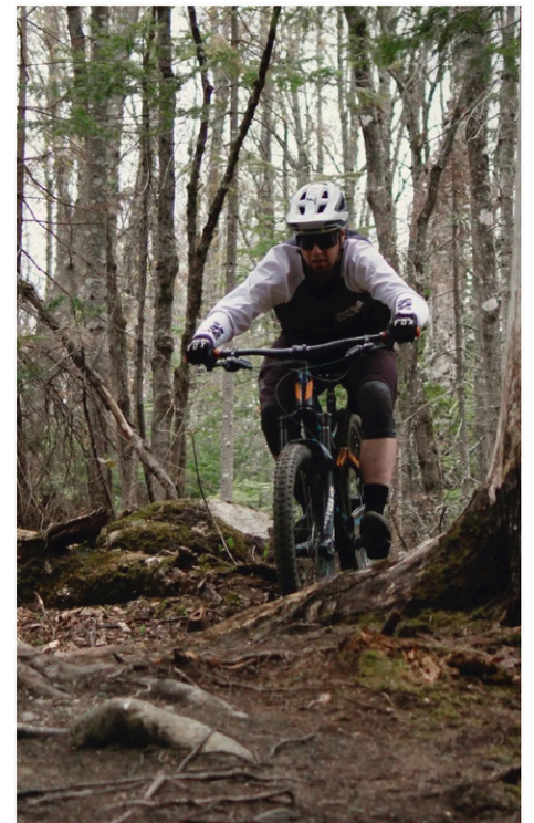
De nouveaux sentiers seront aménagés en vue de la prochaine saison.

Le secteur qui continuera d'être développé se trouve en hauteur au parc du Sommet, près des nouveaux sentiers. « Ce sera différent de ce que nous avons fait l'année dernière. Le parcours sera de niveaux intermédiaire et avancé. Il comprendra de plus gros modules. L'objectif est de diversifier notre clientèle. Pour le moment, nos sentiers sont davantage de forme cross-country, mais nous voulons en créer de type enduro avec des montées et des descentes de plus grande envergure. Nous n'avons pas de montagne comme à Adstock, mais nous essayons de développer le secteur qui est un peu plus pentu afin d'aller chercher d'autres adeptes. Dans notre