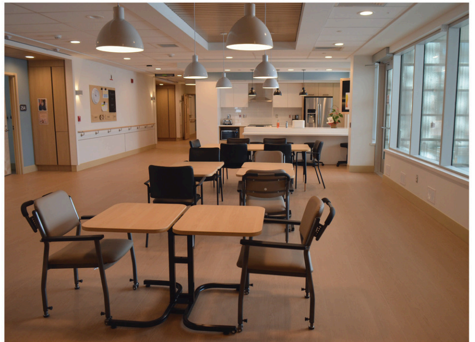
Ce sont deux maisonnées de 12 places chacune qui accueilleront les prochains usagers cet automne.

La MDAA de Black Lake n'est pas le seul établissement du genre à avoir encore plusieurs chambres de libres des mois après son inauguration. Radio-Canada rapportait au début d'août que plus de 1000 lits étaient encore vacants dans les 17 maisons des aînés déjà livrées, dont 13 étaient toujours complètement vides. Un porte-parole du ministère de la Santé et des Services sociaux soulignait qu'il fallait prévoir en délai entre la livraison du bâtiment et l'ouverture des installations aux résidents pour la préparation des locaux, l'arrivée de l'ameublement et la formation du personnel.