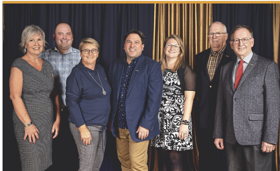
Le conseil municipal d'Adstock

Étant donné que l'origine de l'incendie pourrait être suspecte, le dossier a été remis à la police, a confirmé la porte-parole de la SQ, Hélène St-Pierre. Un enquêteur et un technicien se sont rendus sur les lieux.