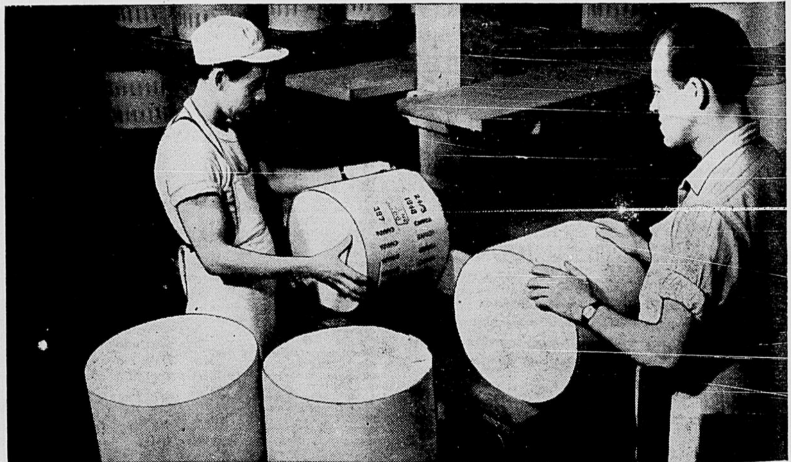
La fabrication du fromage