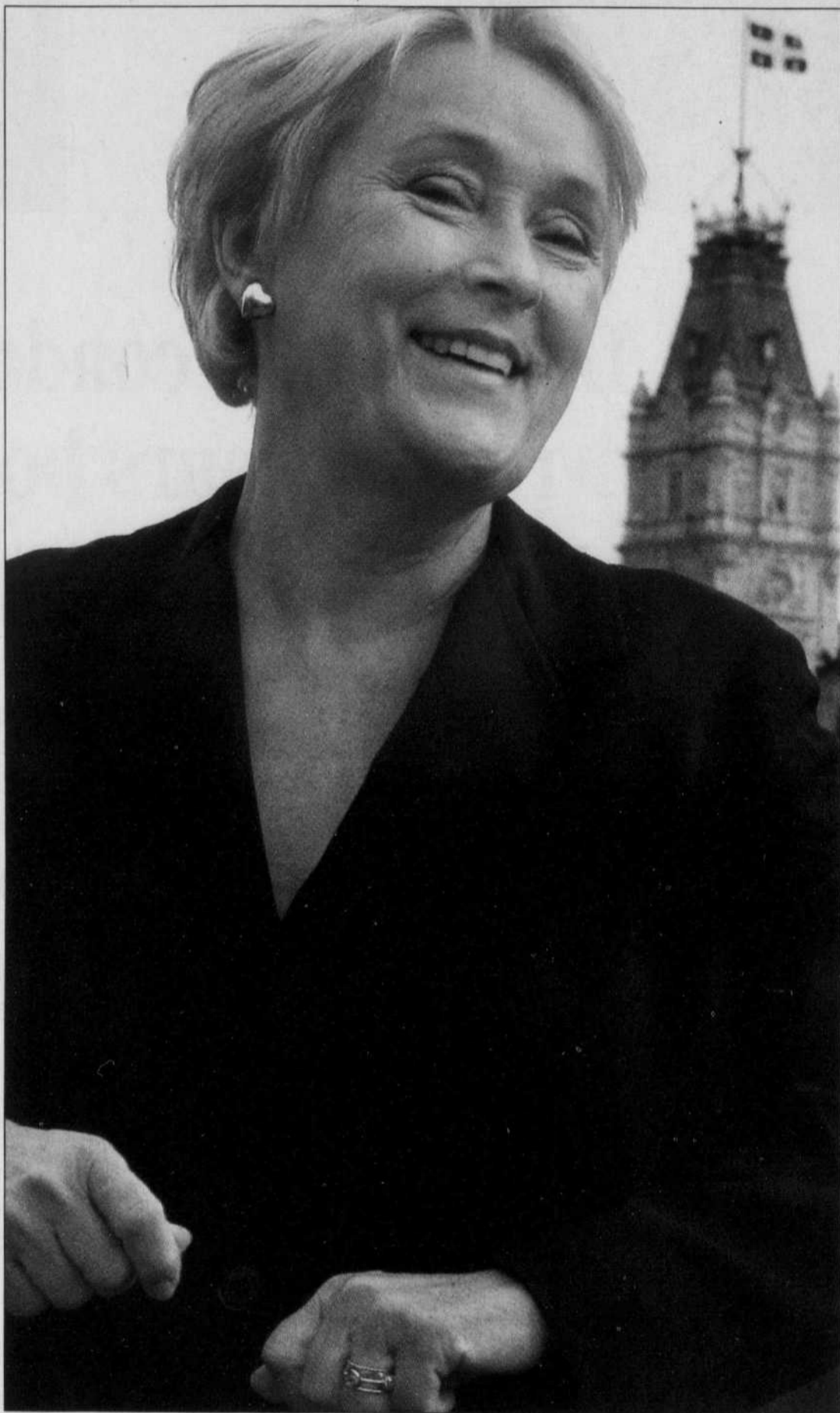
« Nos gestes doivent s'inscrire dans la nouvelle réalité sociale et économique », estime Pauline Marois.