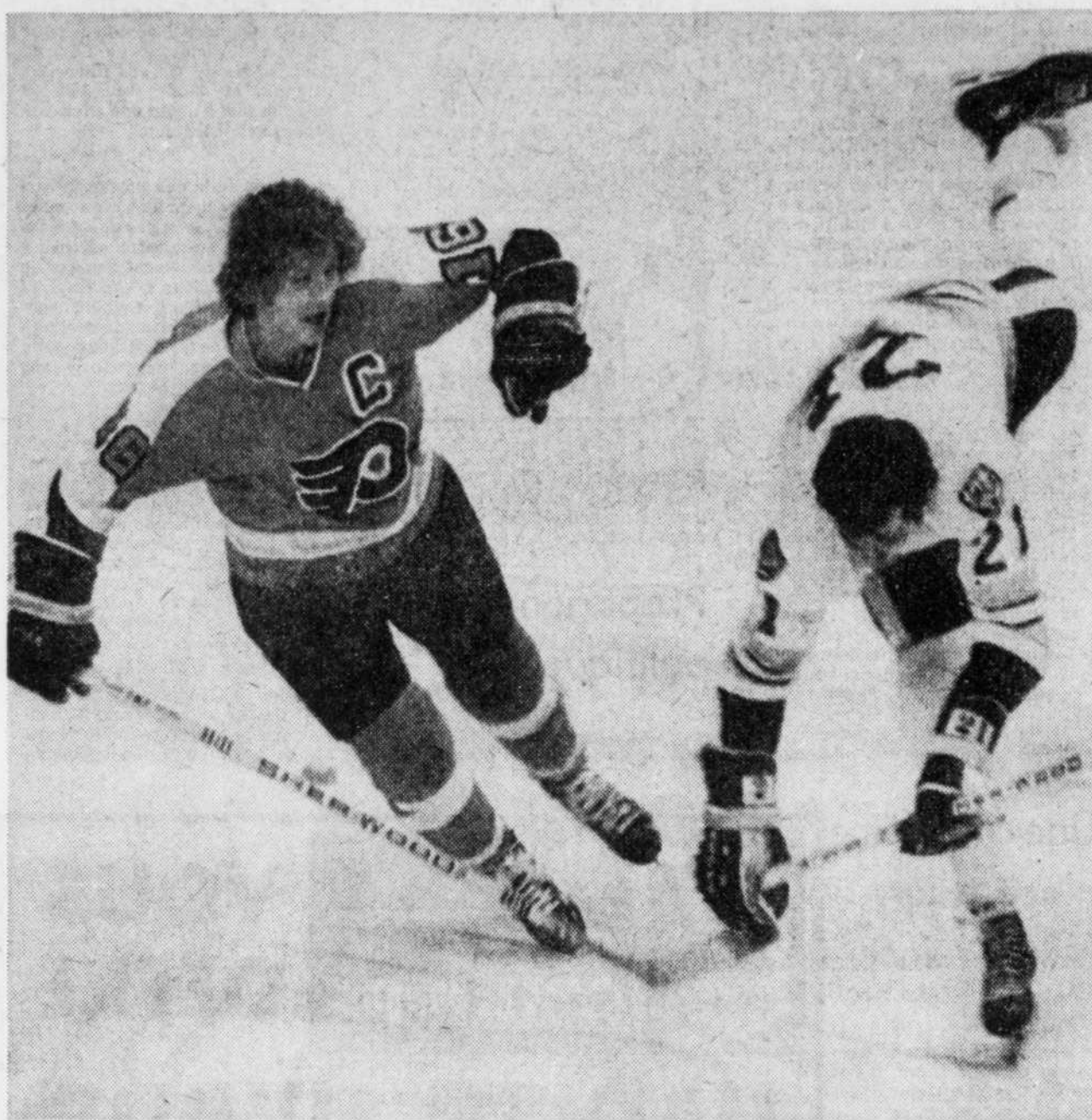
UP1 Pour le style et la grâce sur la glace, aucun doute que Don Marcotte, des Bruins de Boston, surpasse Bobby Clarke, des Flyers de Philadelphie, si on se fie à cette photo. Mais pour l'efficacité, c'est une autre affaire...