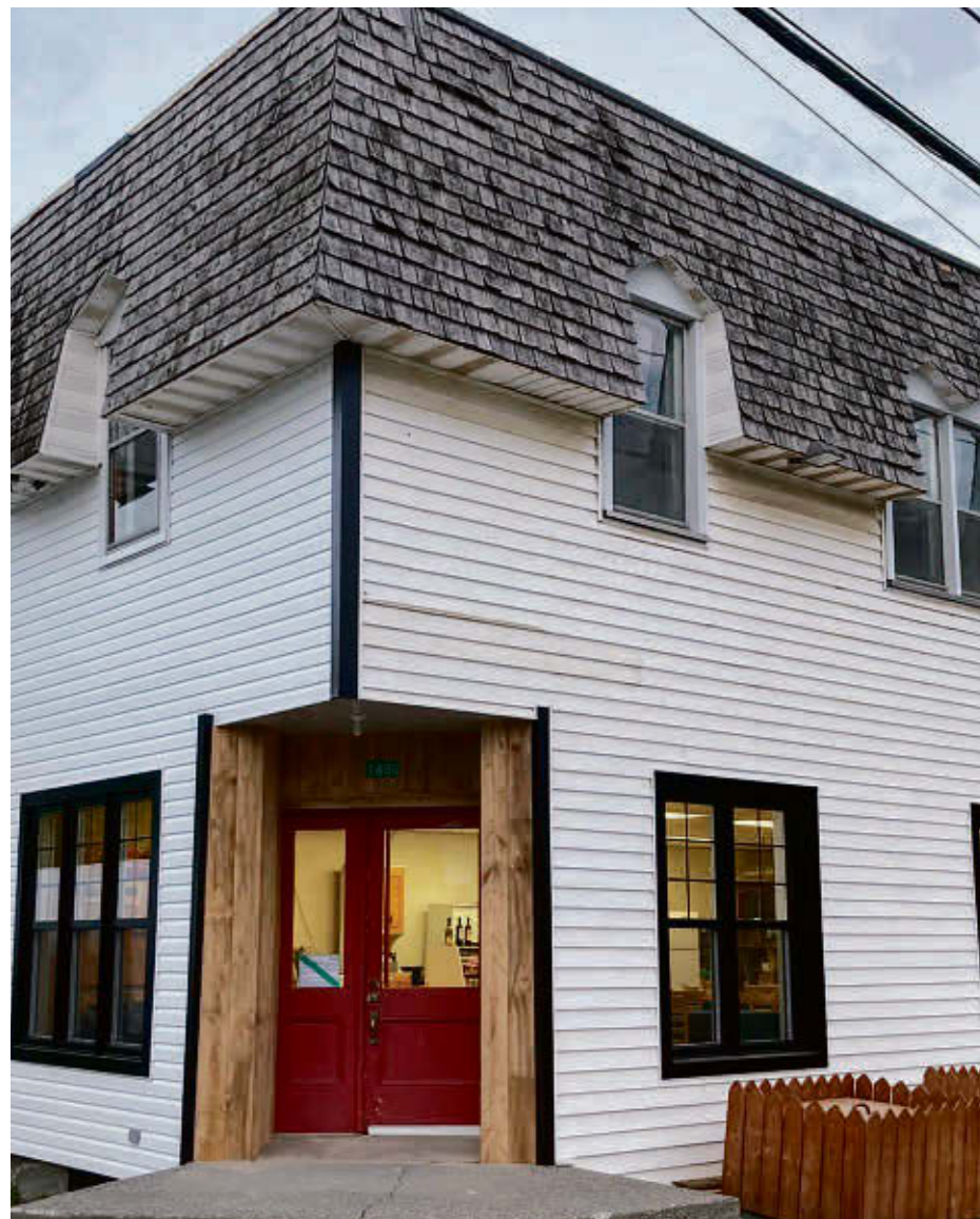
L'ancien magasin général de Lawrenceville, qui accueille des spectacles afin de bien démarrer l'été, fait l'objet de travaux de rénovation.

Pour en savoir plus sur ces spectacles estivaux : www.lawmusegueule.ca .