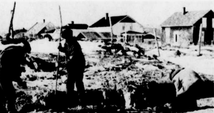
NIVELLEMENT — On voit ici quelques employés du conseil municipal d'East Broughton en train de travailler au nivellement du terrain situé à l'entrée de l'OTJ.