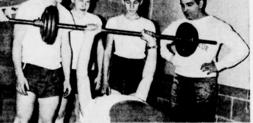
COURS DE CULTURE PHYSIQUE AU CENTRE SOCIAL DE BLACK LAKE — Un bon nombre d'adolescents de 15 à 18 ans, de Black Lake suivent régulièrement les cours de culture physique et de gymnastique donnés les lundis et mercredis soirs, de même que les samedis matins, au Centre social de cette ville.

L'ordre du jour comprend, entre autres items, la présentation des membres des syndicats présents, l'exposé du travail fait par l'exécutif, les amendements possibles à ce travail et autres discussions se rapportant au projet.