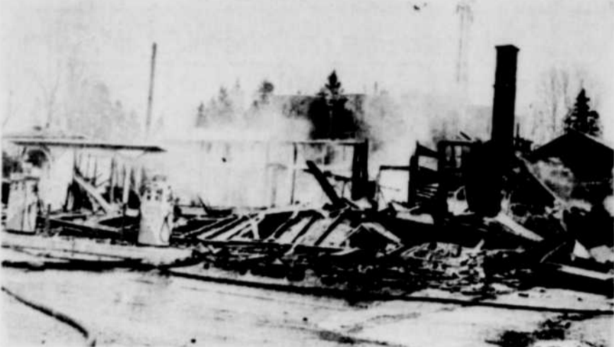
APRES LE PASSAGE DE L'ELEMENT DESTRUCTEUR — Cette photo nous montre ce qui reste de l'imposant édifice qui a été dévasté par les flammes, mardi soir dernier, sur la rue Notre-Dame Nord, à Thetford Mines.

NIVELLEMENT — On voit ici quelques employés du conseil municipal d'East Broughton en train de travailler au nivellement du terrain situé à l'entrée de l'OTJ.