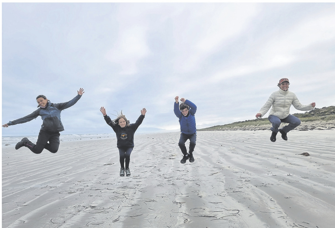
Toute la famille s'est bien amusée en Australie.

Et elle ne donne aucune raison d'en douter. « Quand on a des rêves, on se donne les moyens de les réaliser. »