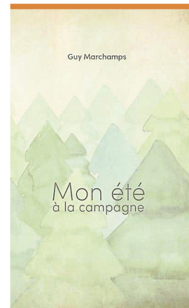
Le livre de poésie destiné au public jeunesse a paru en septembre 2023 chez Soulières éditeur.

Ses lecteurs aussi. C'est pourquoi son tout petit été à la campagne aura bien d'autres suites en librairie, pour les petits comme pour les grands. «Comme j'ai du temps, je vais recommencer à publier avec plaisir», conclut l'auteur. On ne demande pas mieux.