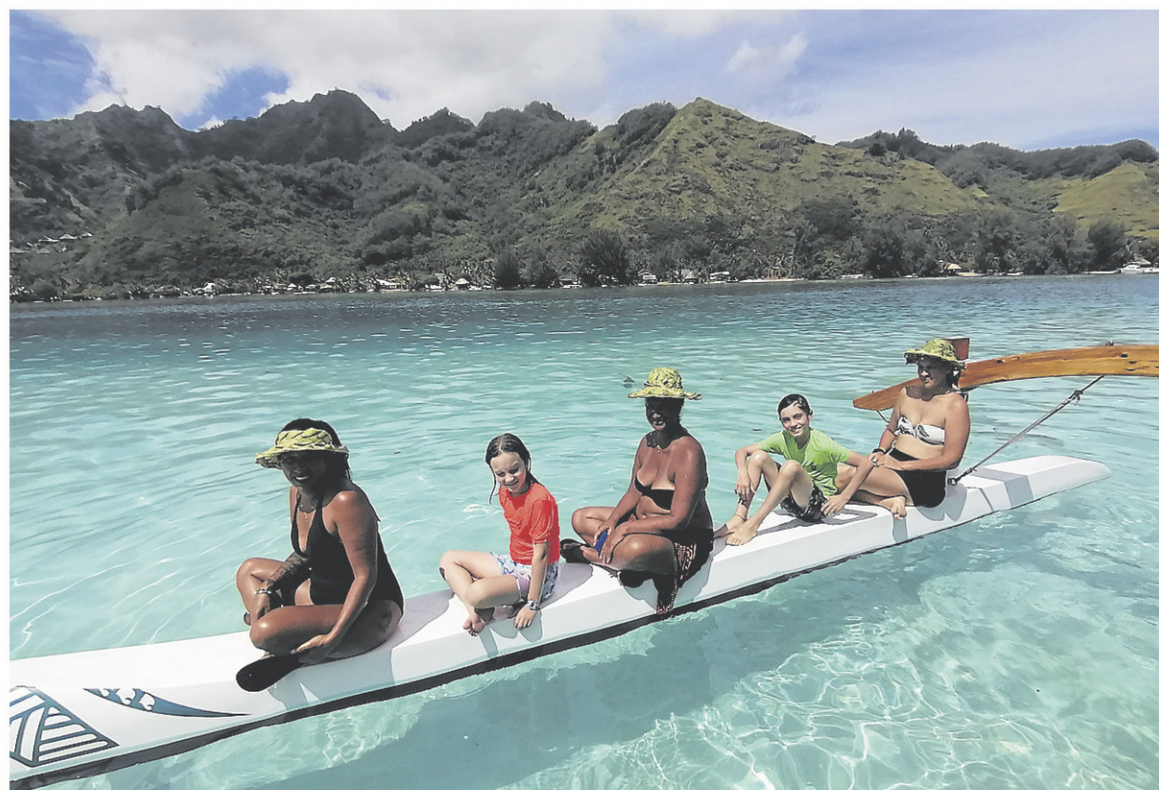
La Polynésie française aura été composée de vraies vacances. Il s'agit du seul pays où les enfants ont eu congé d'école.

« Il y a tellement de nature. Les deux tiers de la population sont nomades, si bien que les enfants doivent être pensionnaires pour aller à l'école. Ils vivent encore de façon rustique », résume Stéphanie.