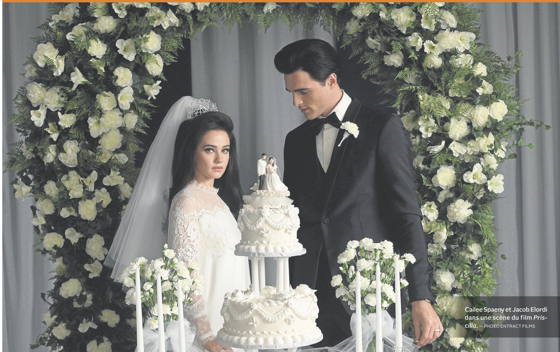
Cailee Spaeny et Jacob Elordi dans une scène du film Priscilla .