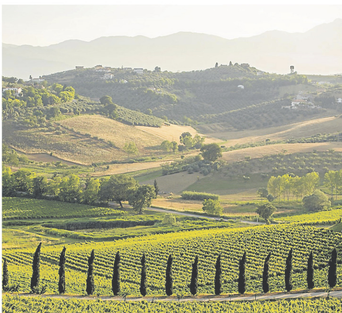
La région des Abruzzes est l'un des secrets les mieux gardés d'Italie.

Le pecorino est un cépage à la peau plus épaisse qui produit des vins de style gastronomique avec une texture qui rappelle celle des vins rouges, de par sa légère expression tannique. Celui-ci est particulier, car il transmet une histoire familiale digne d'une épopée. En 1910, l'arrière-grand-père napolitain Vincenzo achète une terre de 20 hectares dans les Abruzzes. Il plante des vignes et les cultive avec soin jusqu'à ce que son domaine soit complètement détruit durant la Deuxième Guerre mondiale, menant la famille à la pauvreté.