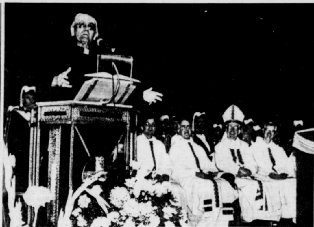
Le cardinal Paul-Émile Léger s'est aussi adressé aux gens réunis au Memorial Gardens, de North Bay, hier.

Dans le centre sportif de North Bay, il y avait plus de 2,000 francophones réunis hier. La veille, au cours d'une soirée de gala, l'écrivaine Antonine Maillet avait déclaré: "Tant qu'il y aura des bals pour les francophones, la langue sera protégée".