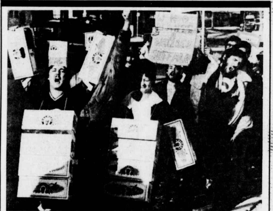
Ils l'aiment comme ça. Un groupe de citoyens engagés ont protesté en fin de semaine, à Calgary, devant la brasserie O'Keefe. Ces amateurs de bière protestaient contre la décision de la compagnie de retirer du marché la marque "Calgary" pour la remplacer par une bière légère.

question de savoir si les ventes de chaussures étrangères nuisaient aux fabricants américains. Cette décision, intervenue, cette semaine, fait suite à la demande formulée l'automne dernier à la démission par le comité de finance au Sénat, de reprendre son enquête sur les importations de chaussures. Celles-ci comptaient pour 72 pour 100 des ventes aux États-Unis en 1984.