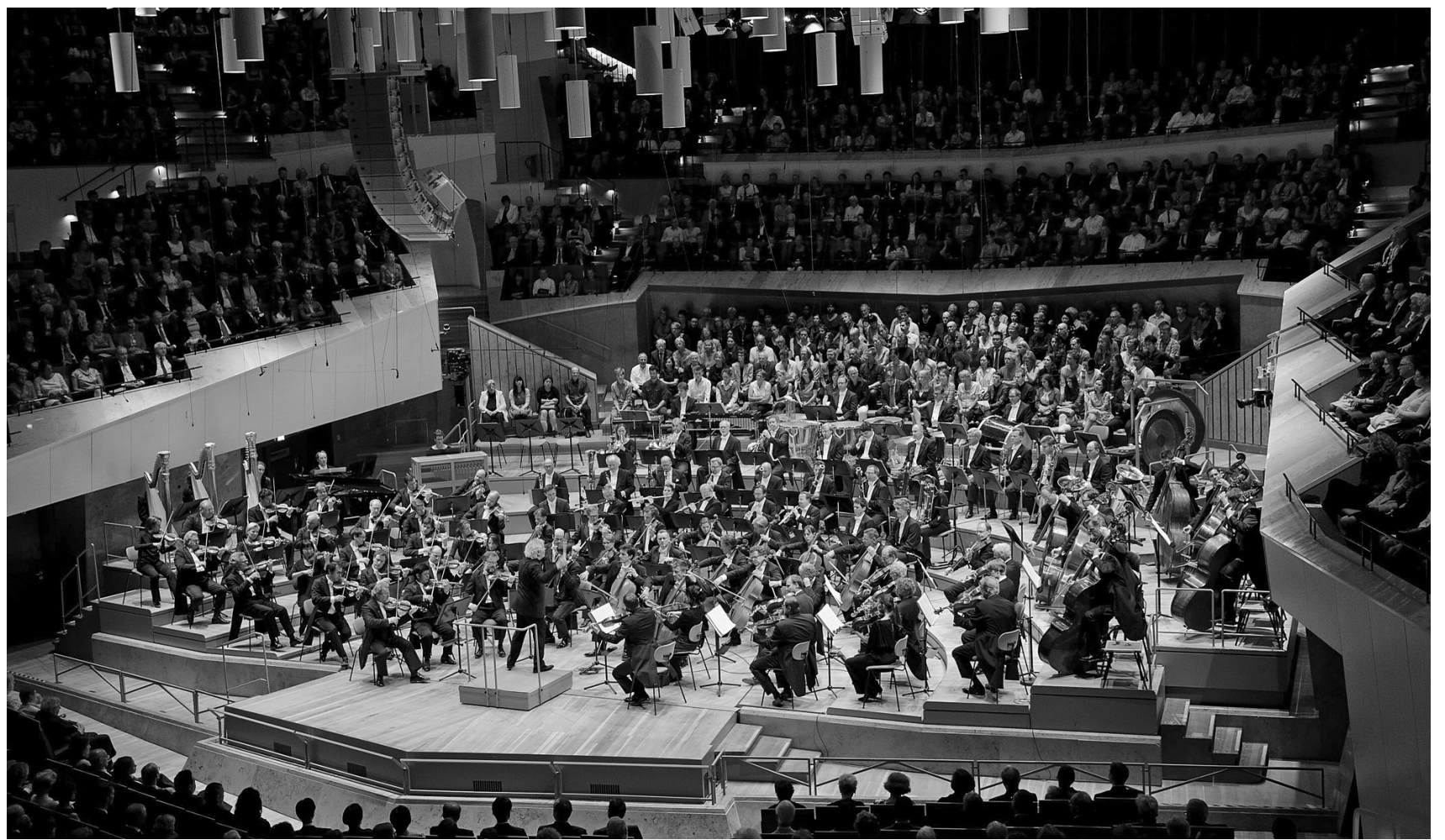
Le Philharmonique de Berlin, un phare du monde de la musique classique, en concert lors de l'ouverture de sa saison 2014-2015.