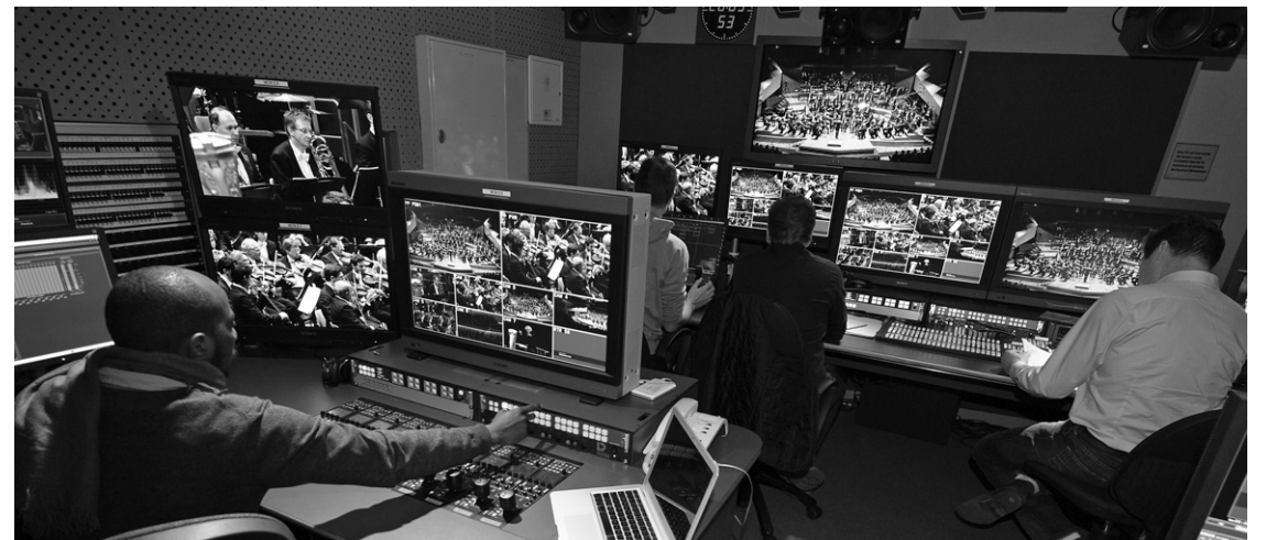
Les coulisses des diffusions des concerts en direct