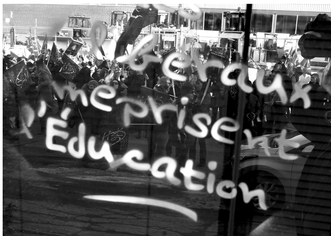
Des membres du gouvernement Couillard aux associations étudiantes, bien peu peuvent s'enorgueillir d'avoir pensé et agi avec brio...

Je passerais donc à la note suivante qui concerne un groupe d'individus : les associations étudiantes. Ici encore, la note E s'impose. Décidément, on va croire que je mets E parce que je ne connais pas d'autres notes, je peux vous assurer que ce n'est pas le cas. Mais les grévistes ont tellement mal articulé les motifs qui les ont poussés à cette grève justifiée que leur allié naturel, la population, ne les comprend ni ne les soutient. Il en est de même pour les multiples syndicats qui les évitent comme la peste.