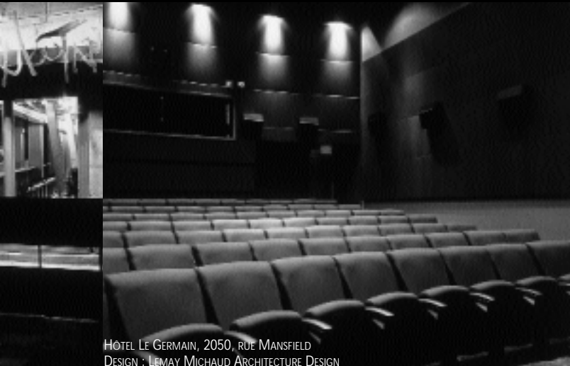
HÔTEL LE GERMAIN, 2050, RUE MANSFIELD DESIGN : LEMAY MICHAUD ARCHITECTURE DESIGN