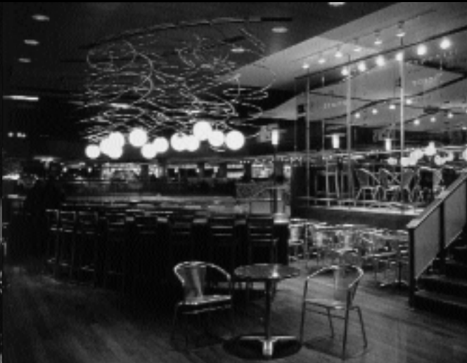
ATRIUM DU 1000, DE LA GAUCHETIÈRE DESIGN : @DIFICA