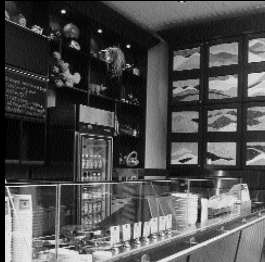
NEW-YORK DAILY SOUP, 2000, AVENUE MCGILL COLLEGE DESIGN: LEMAY MICHAUD ARCHITECTURE DESIGN

Esquisses a le plaisir de vous présenter les projets, réalisés par des architectes, lauréats de l'édition 2000 de Commerce Design Montréal. Rappelons que Commerce Design Montréal est un concours organisé par le Service de développement économique de la Ville de Montréal, en collaboration avec la Société des designers d'intérieur du Québec et l'Ordre des architectes du Québec.