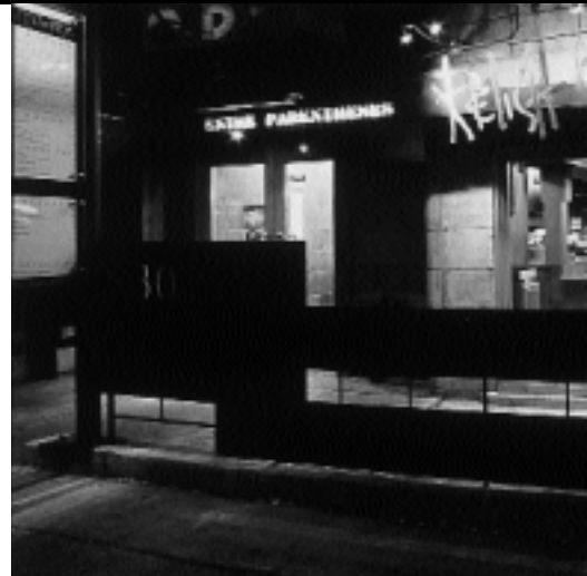
RELISH MOUTARDE, 3807, RUE SAINT-DENIS DESIGN : PIERRE MORENCY, ARCHITECTE