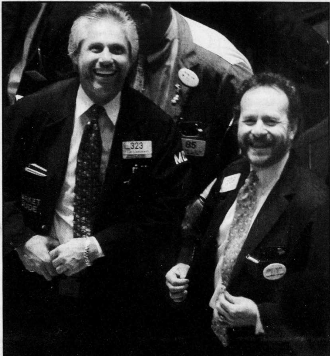
Retour du sourire, hier, chez les courtiers des places boursières.

Toronto n'est pas en reste. Le TSE 300 a été emporté par la vague en terminant à 7572,28. Sa hausse, de 156,83 points ou de 2,1 %, a cependant été plus modeste. Parmi les titres-vedettes, Nortel a terminé avec un gain de 5 %, à 21,45 $, soit une poussée simi-