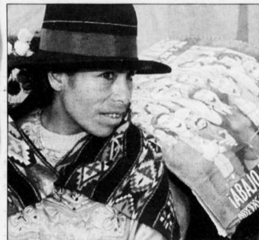
Mille langues, pour la plupart amérindiennes, sont parlées au sein des 35 pays des Amériques.

Le Groupe interdisciplinaire de recherche sur les Amériques (GIRA) organise un colloque international intitulé «Le grand récit des Amériques: la polyphonie des identités culturelles dans le contexte de la continentalisation» , les lundi 9 et mardi 10 avril 2001 à la Cinémathèque québécoise (335, boulevard De Maisonneuve Est, à Montréal). Renseignements: http://gira.inrs-urb.uquebec.ca . Dans ce cadre, Le Devoir a publié de lundi à jeudi, en collaboration avec l'Association internationale des études québécoises (AIEQ) et le GIRA, une série de textes rédigés par certains des conférenciers invités. Le colloque aborde les questions de culture, de langues, d'identités, le rôle des métropoles comme lieux de convergence et de métissage, l'effet des accords de libre-échange sur la définition des frontières nationales et la perspective de création d'une citoyenneté continentale. Il est encore possible de s'inscrire.