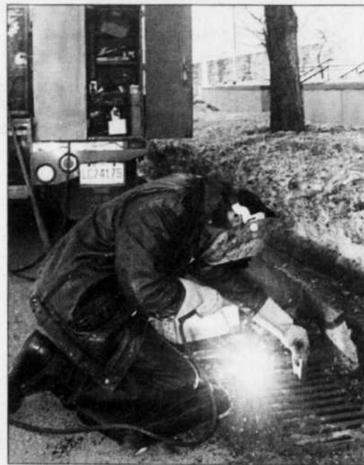
RENE MATHIEU LE DEVOIR

Cela étant, la CECC ne balait pas du revers de la main tout accord de libre-échange. Les évêques souhaitent plutôt que d'éventuelles ententes placent la démocratisation en Amérique, l'équité économique, la protection de l'environnement et la personne dans toute sa dignité au cœur de tous les débats.