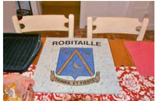
The Robitaille coat of arms in California / Les armoiries des Robitaille en Californie