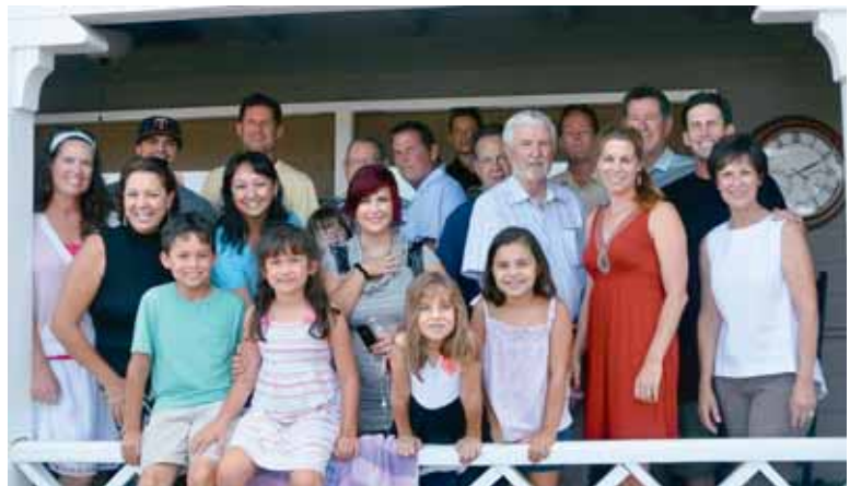
All the Robitaille's at the Robitaille gathering / Tous les Robitaille présents à la rencontre des Robitaille