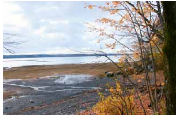
Ouverture du marais sur le fleuve

Une centaine de mètres plus loin, le groupe décide de quitter ce sentier et de descendre directement au bord du fleuve à environ 0,5 km. Les premiers cent mètres du sentier sont en pente assez abrupte. Mais, comme il est agréable de circuler