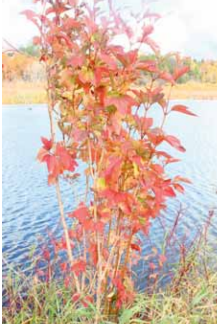
Un arbuste récalcitrant à perdre ses couleurs automnales

Le dimanche 19 octobre 2014, nous sommes au marais Léon-Provancher, situé à la limite est de la ville de Neuville. Le firmament, légèrement voilé,