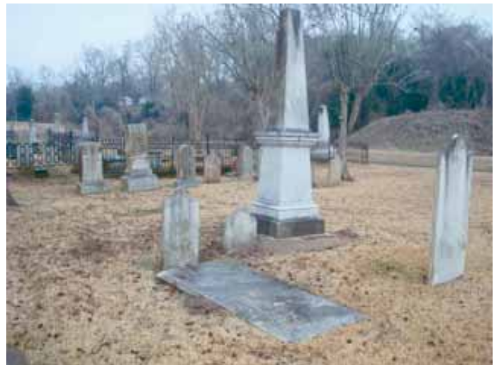
Figure 5. Wade Plot in Natchez City Cemetery / Lot Wade au cimetière de la ville de Natchez