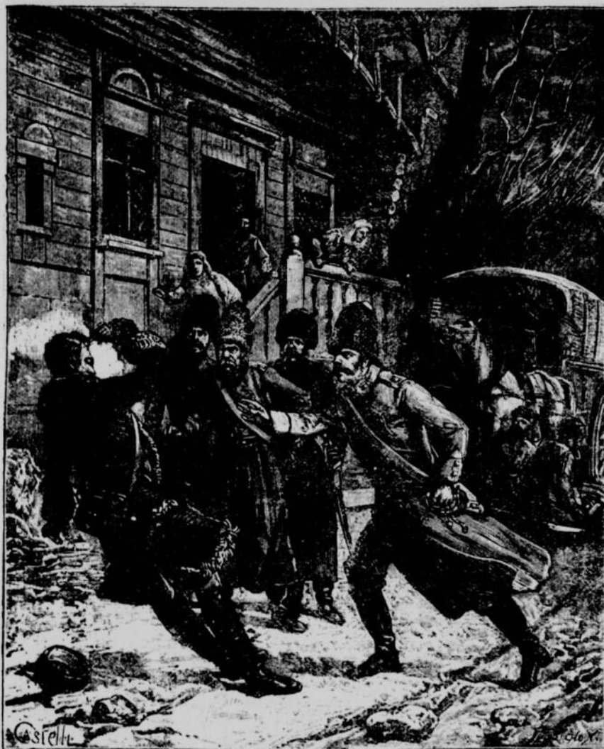
D'un troisième coup de revolver il se fit sauter la cervelle. — (Page 38, col. 1).

Tout en guettant sa sortie, il imagina que s'il pouvait aposter près de la maison un drochky , sorte de fiacre découvert à deux places, stationné non loin de là, l'étranger le prendrait peut-être en sor-