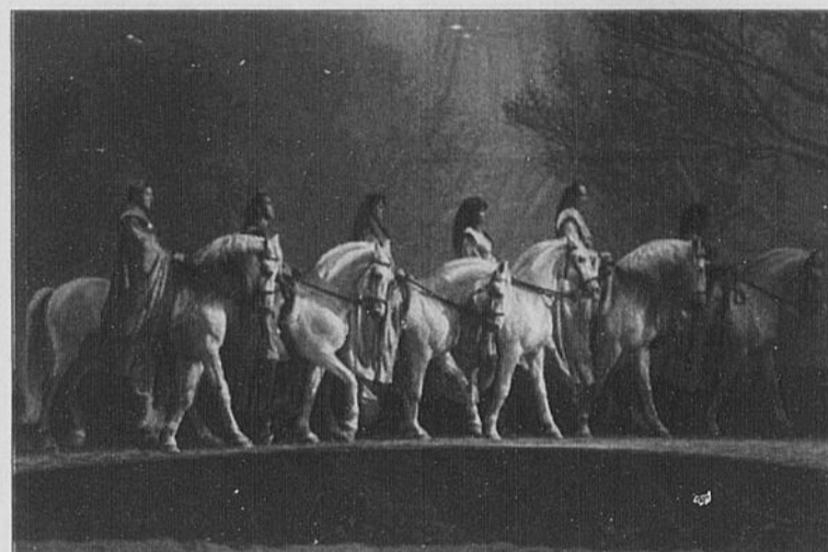
CAROUSSEL - Le Carrousel formé de six cavaliers et chevaux.