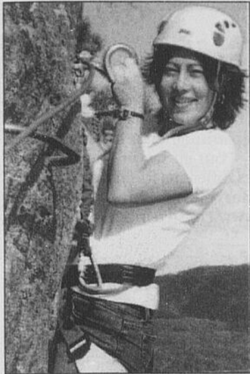
VIA FERRATA - Cet été vivez une expérience d'itinéraire sécurisé en milieu vertical avec la Via Ferrata.

Imaginez une paroi rocheuse verticale et surplombante qui plonge dans les eaux du fjord! C'est ce que vous propose le Parc Aventures Cap Jaseux, en exclusivité régionale, avec la Via Ferrata. Une nouvelle activité inaugurée pour le 6 e anniversaire du Parc Aventures.