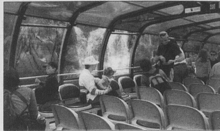
CAP LIBERTÉ - Le bateau-mouche Cap Liberté permet de vivre une croisière différente par sa capacité à se rapprocher davantage des trésors qu'offre le fjord, comme les falaises escarpées des caps Trinité et Éternité.

Cette croisière vous dévoilera les charmes du fjord, ses caps Trinité et Éternité, sans oublier la statue de Notre-Dame-du-Saguenay que vous pourrez contempler.