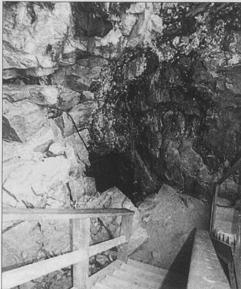
SPÉLÉOLOGIE - La caverne du Trou de la Fée, à Desbiens, permet aux aventuriers de tous âges de vivre une première expérience de spéléologie en toute sécurité.

La Société touristique de Desbiens travaille au développement de ce sentier depuis deux ans et a pu réaliser ce projet avec l'aide du programme de mise en valeur des forêts, géré par les MRC.