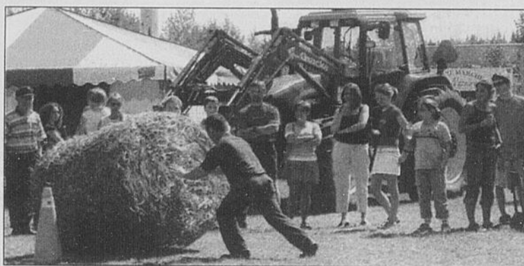
OLYMPIADES - Les Olympiades agricoles du festival Saint-Nazaire en Fête auront lieu le dimanche 30 juillet 2006.

Du 28 au 30 juillet 2006 aura lieu la 3 e édition du festival Saint-Nazaire en Fête, au Centre communautaire de la municipalité. Plusieurs activités basées sur le thème de l'agriculture seront organisées. Courses de tracteurs à gazon, tir de quatreroles, démonstration de tonte de mouton, olympiades agricoles, concours de la