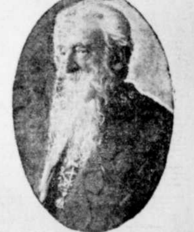
Le général Booth, de l'Armée du Salut, décédé hier soir

Londres, 21.—Le Rév. William Booth, général et commandant en chef de l'Armée du Salut, est mort hier soir vers 10h. 13 à l'âge de 82 ans, à sa résidence à "Rookstone", Headleywood, à 8 milles de cette ville. Son fils, M. Bramwell Booth lui succédera probablement. Les membres anglais de l'Armée du Salut, refusent cependant de laisser déposer le corps du général dans l'abbaye de Westminster. Le général Booth, de l'Armée du Salut, décédé hier soir