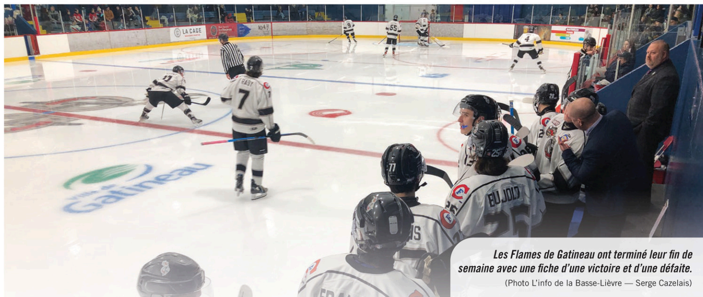
Les Flames de Gatineau ont terminé leur fin de semaine avec une fiche d'une victoire et d'une défaite.