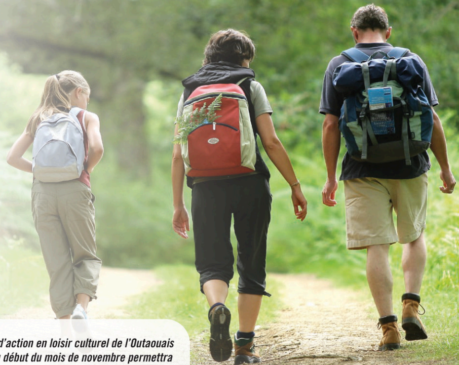
Le Plan d'action en loisir culturel de l'Outaouais lancé au début du mois de novembre permettra l'éclosion de plusieurs projets et actions et de les harmoniser.

« Plusieurs vivent les mêmes enjeux (roulement de personnel, épuisement des bénévoles, manque de visibilité et de financement). Grâce à la concertation, on apporte des solutions qui vont émaner du milieu et des personnes qui travaillent vraiment sur le terrain. En concertation, l'information circule mieux, également », poursuit-elle.