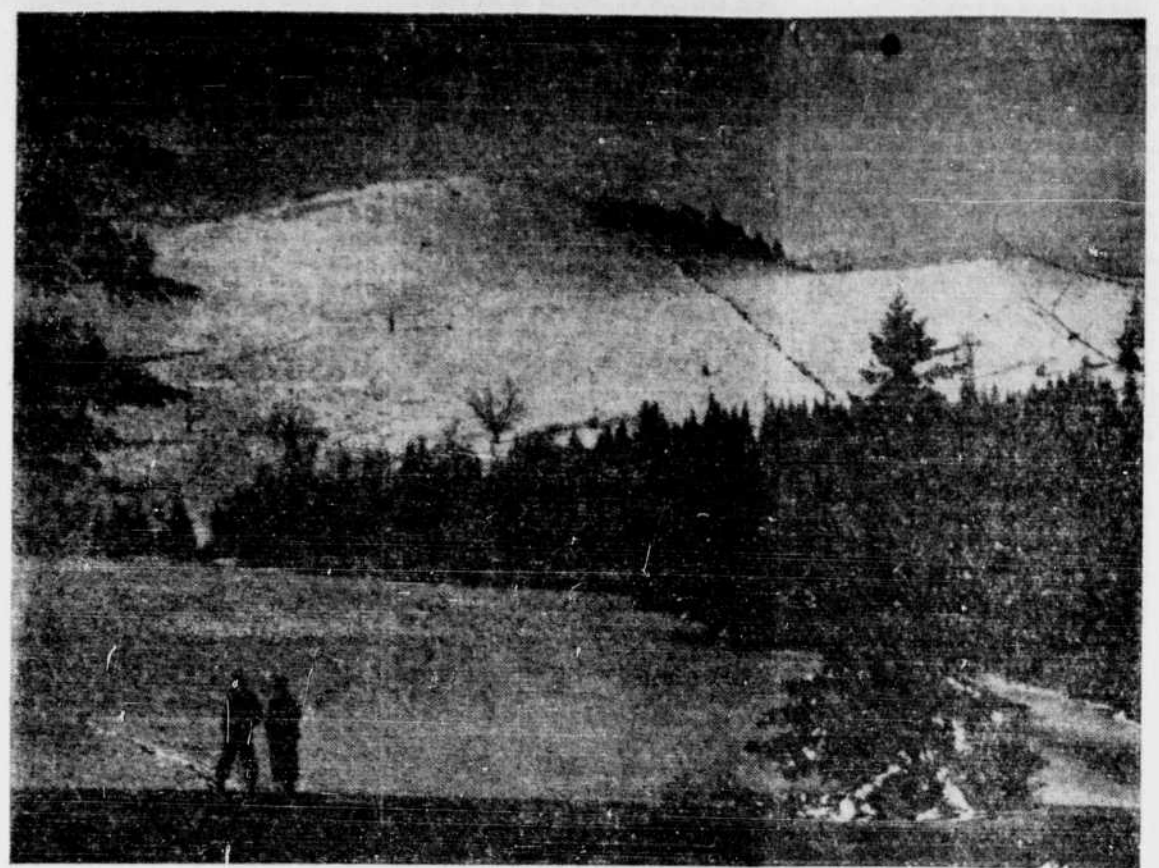
Un autre magnifique paysage de ski des Cantons de l'Est, sur la piste du Mont-Shefford, membre de la Zone de Ski des Cantons de l'Est. Les pistes sont nombreuses et variées sur la piste du Mont-Shefford, entre Granby et Waterloo. Depuis quelques hivers, c'est-à-dire depuis que le cross-country connaît sa vogue actuelle, les skieurs ont appris à apprécier les avantages que leur offre cette montagne comme tous les autres pistes des clubs de ski des Cantons de l'Est. C'est maintenant par centaines, qu'à chaque fin de semaine ils s'engagent sur la piste du Mont-Shefford pour "s'essayer" dans la grande descente.