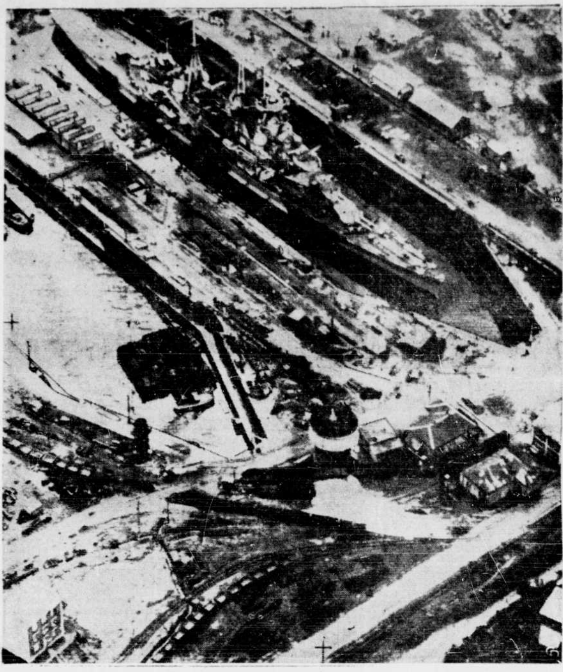
La photographie ci-dessus d'un croiseur allemand de la classe du "Hipper", dans le port de Brest. Le plus facile à défendre de tout le continent européen, fut prise par un aviateur audacieux qui descendit jusqu'à 500 pieds au-dessus du port pour relever son exploit. Elle fut prise par un pilote britannique qui illustre la publication du ministère de l'Air britannique sur le travail du commandement côtier depuis le début de la guerre.