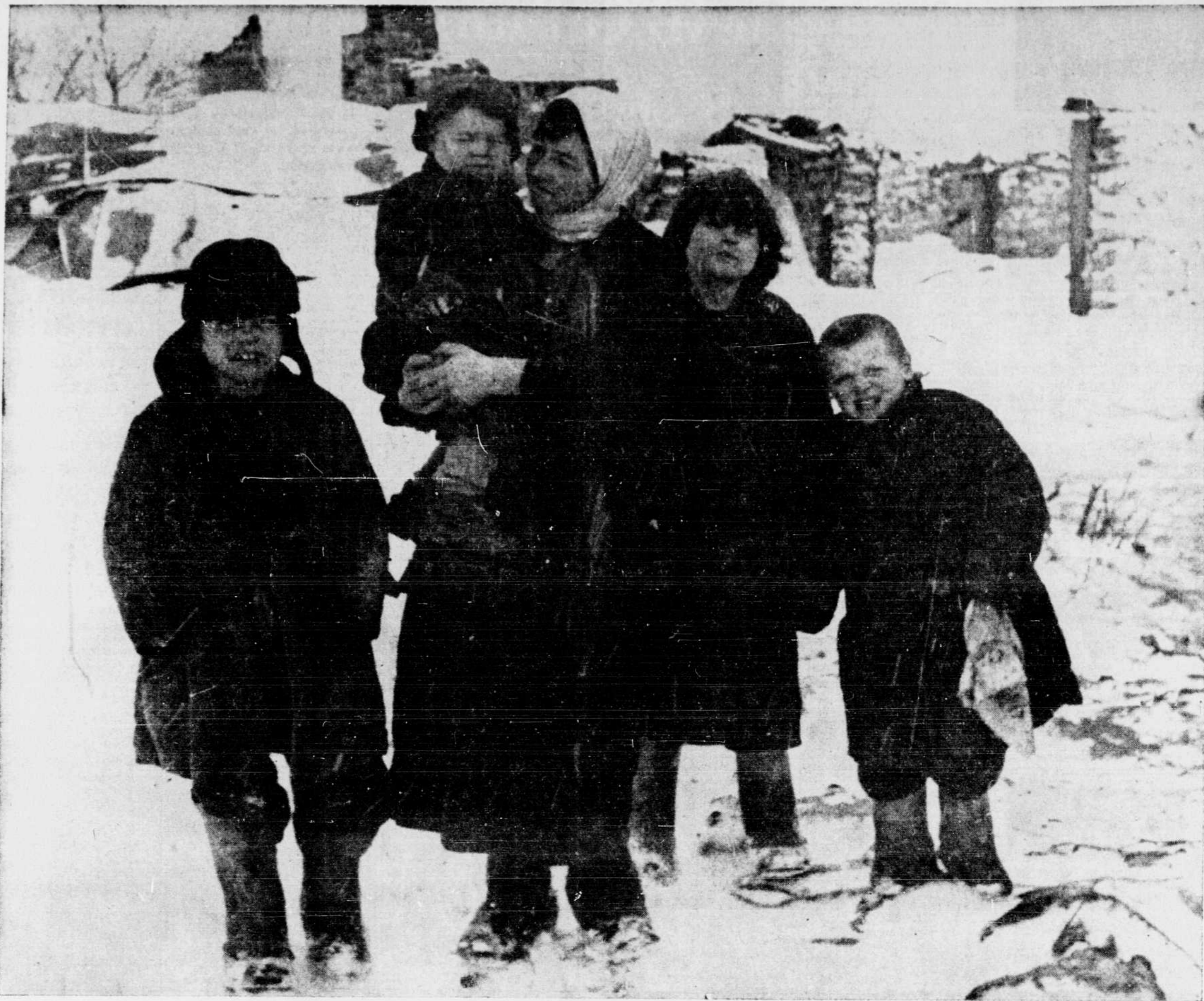
(Vignette gracieusement fournie par la Maison T. Eaton Company, de Montréal)