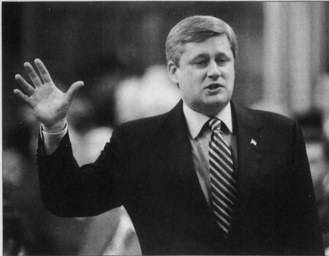
Stephen Harper a dû se résoudre à nommer un nouveau président au Comité permanent sur les langues officielles.

Selon le libéral Pablo Rodriguez, le gouvernement n'avait plus le choix de reculer. «Leur