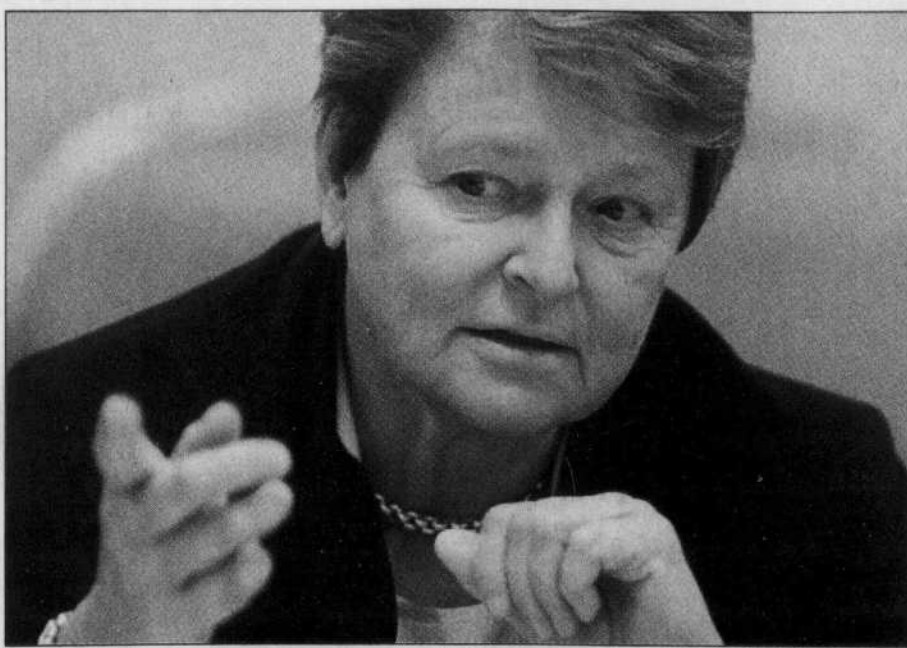
La planète n'a pas encore vraiment pris le chemin du développement durable, estime l'auteur du concept, l'ancienne première ministre de la Norvège, Gro Harlem Brundtland. JACQUES NADEAU LE DEVOIR