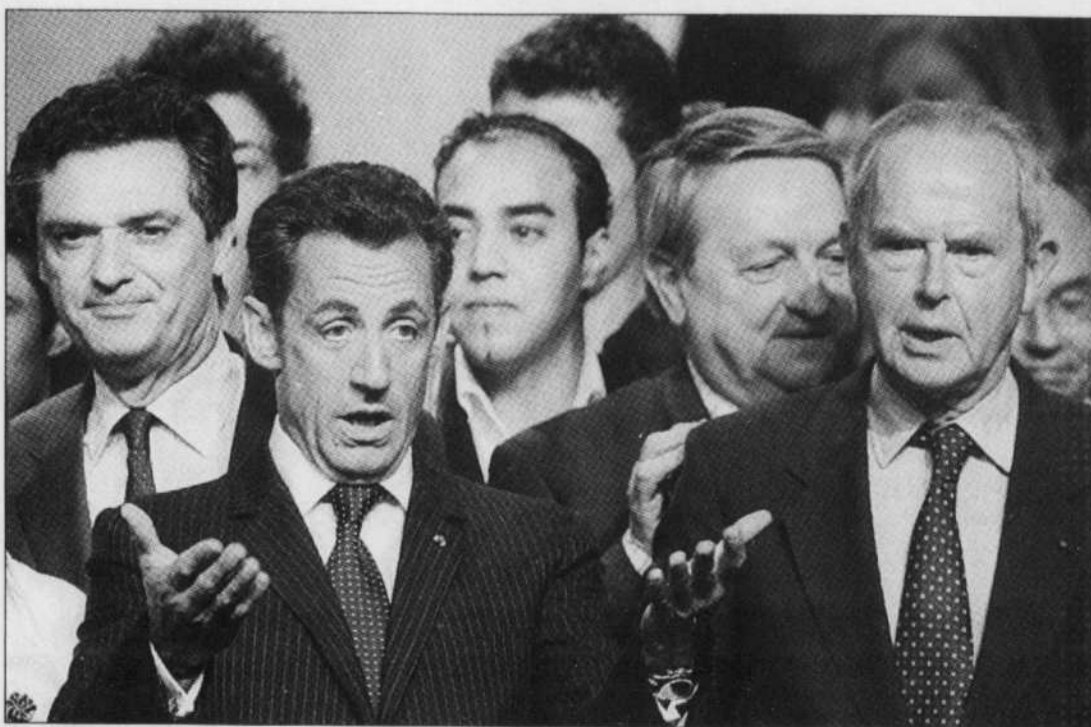
Nicolas Sarkozy en campagne hier au Havre.

Les sondages sur les intentions de vote des Français sont tous largement favorables à la droite. Le dernier en date, de l'institut Ipsos, donne 43,5 % des voix à l'UMP au premier tour, contre 28,5 % au PS et à ses alliés. À l'issue du deuxième tour, l'UMP et les divers droite devraient obtenir entre 380 et 442 des 577 sièges, soit largement