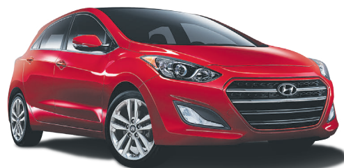
Modèle Limited montré*