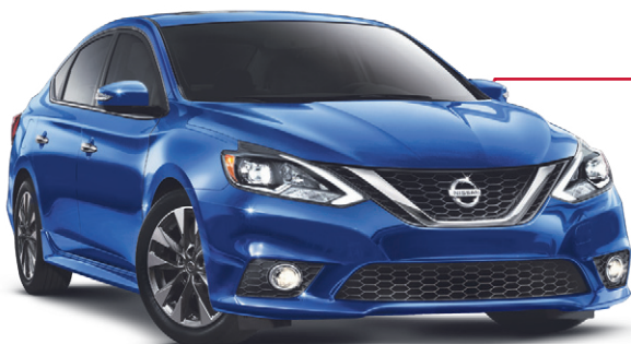
Sentra 1.8 SR avec boîte CVT illustrée*