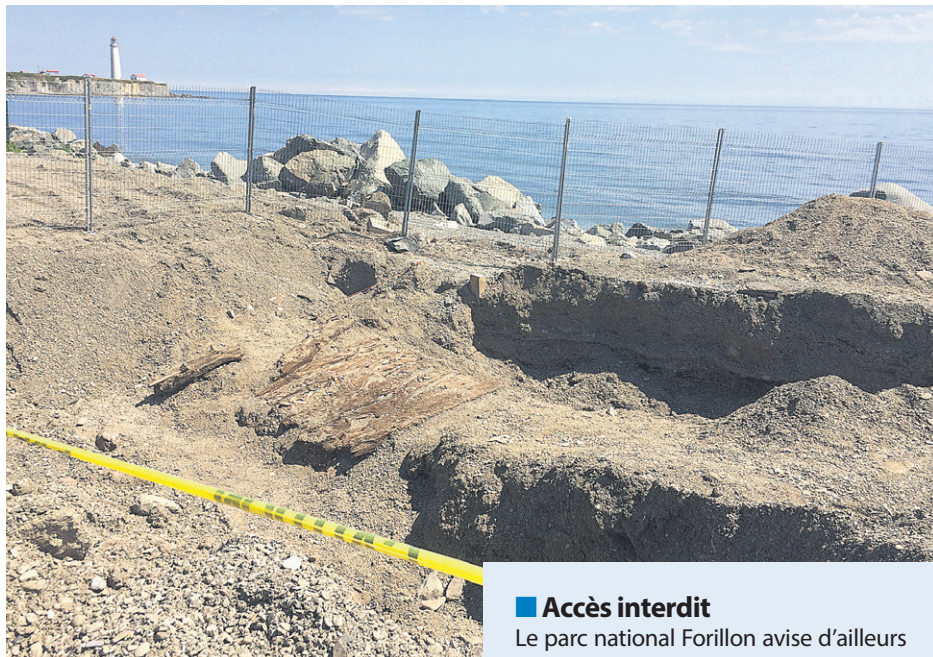
Les premiers ossements ont été découverts le 27 juillet.

« C'est une hypothèse très plausible en effet, et les éléments sur le terrain pointent