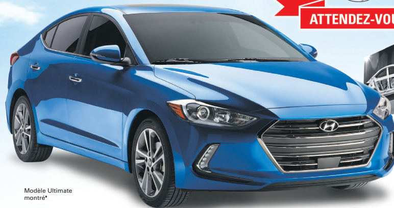
Modèle Ultimate montré*