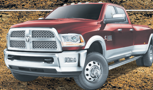
Ram 3500 Laramie 4X4 2016 à cabine d'équipe, roues arrière jumelées et moteur turbo diesel Cummins MD montrée**

JUSQU'À 31 210 LB | JUSQU'À 3,5 TONNES DE PLUS QUE LA CONCURRENCE: