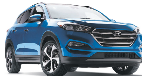
Modèle Ultimate montré*