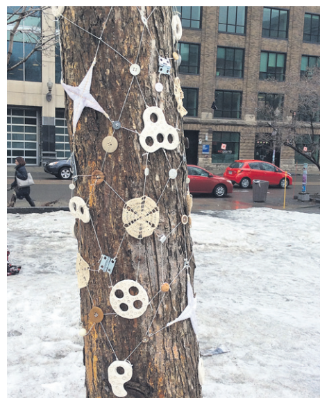
Œuvre réalisée par Élise Dubé.

Rappelons que la Triennale Internationale des Arts Textiles en Outaouais est un événement culturel majeur et international, diffusant le monde des arts textiles contemporains.