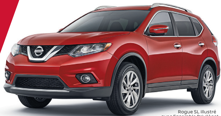
Rogue SL illustré avec Ensemble Privilège*

lorsqu'il est équipé du système de freinage d'urgence