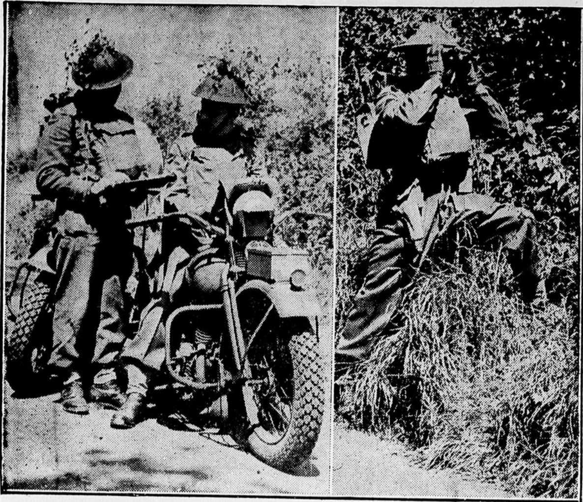
Le beau travail de nos soldats canadiens outre-mer suscite des commentaires des autorités anglaises. On peut voir ci-dessus des signaleurs étudiant la route qu'ils devront suivre. A droite, le soldat semble chercher l'ennemi, caché dans les broussailles.