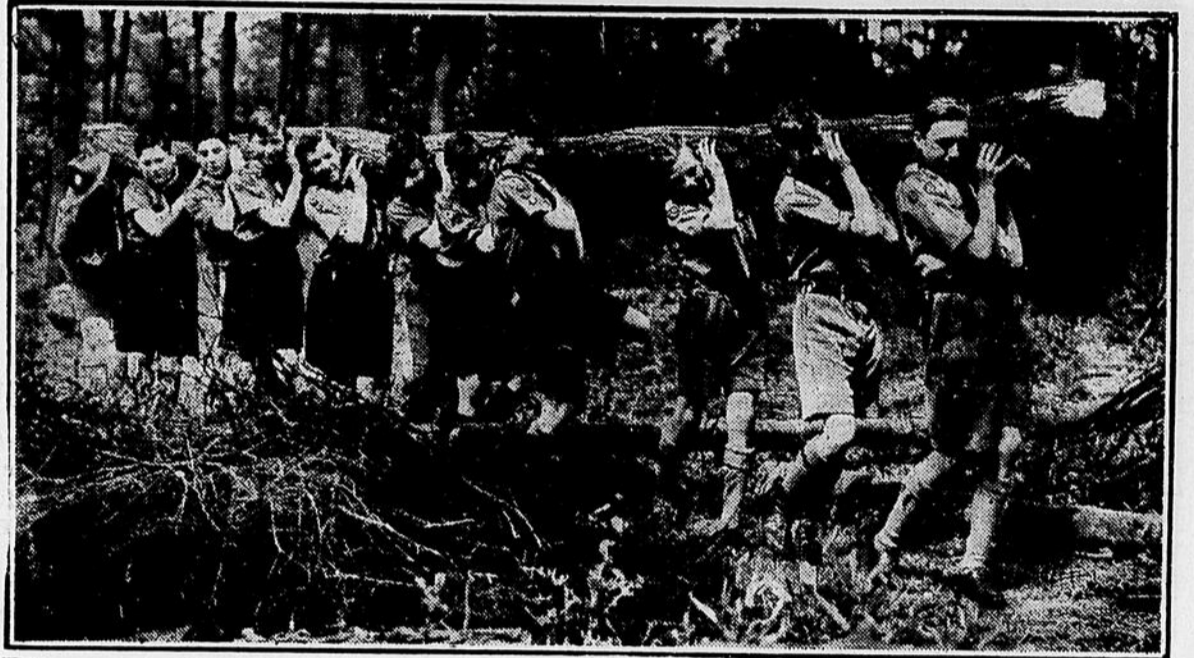
Les jeunes et les plus âgés font un beau travail en Angleterre surtout après une attaque aérienne. Les Boy Scouts, photographiés ci-dessus, sont d'excellents bûcherons. Ils ont réussi à abattre cet arbre mais plus d'onze d'entre eux sont requis pour le transporter.