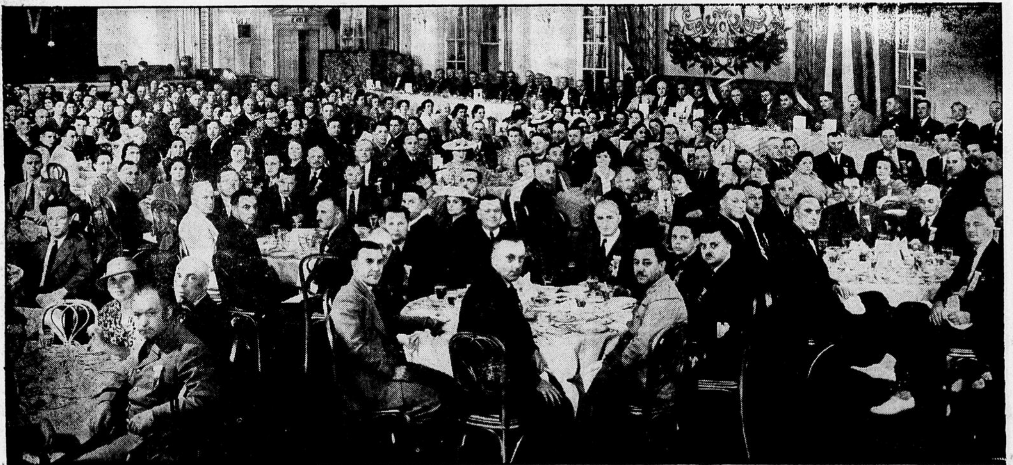
Le dixième banquet annuel de l'Association des chefs de polices et de pompiers de la province, donné à l'occasion du congrès de l'Association qui s'est tenu à l'Hôtel Windsor, à Montréal, réunissait le 23 juillet dernier plus de 300 membres de l'Association. Il nous fait plaisir de voir que la cité de Salaberry de Valleyfield a été dignement représentée à ce congrès. Dans la photographie ci-dessus