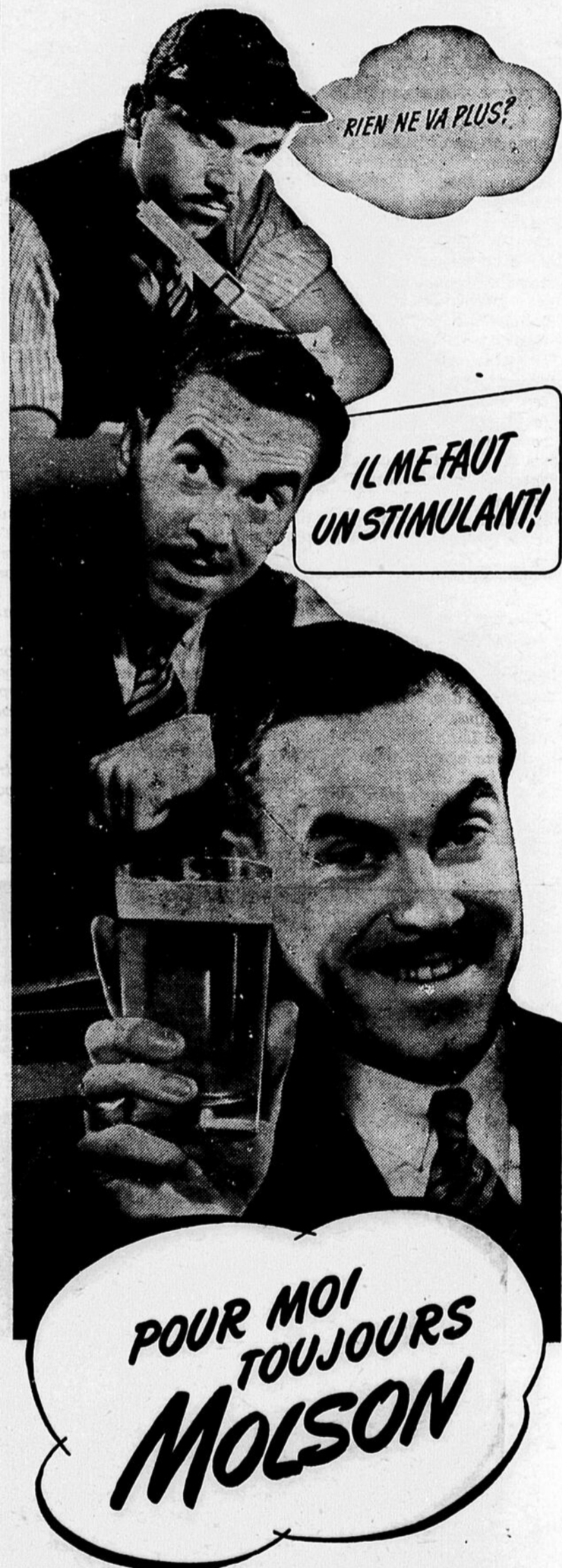
LA BIÈRE QUE VOTRE ARRIÈRE-GRAND-PÈRE BUVAIT