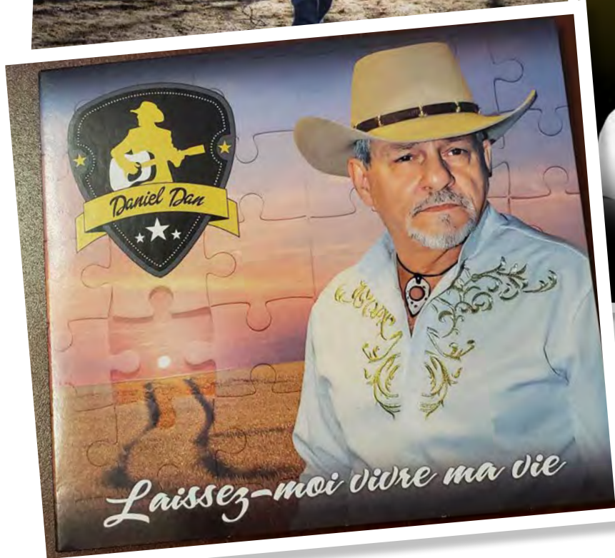
Chronique country courtoisie