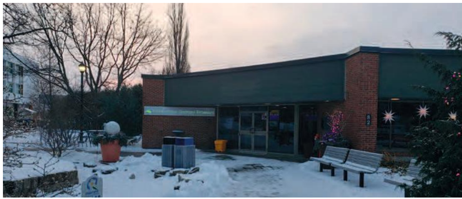
La rencontre aura lieu à la bibliothèque Georges-Brossard.