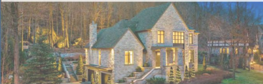
528, DU SOMMET MONT-SAINT-HILAIRE