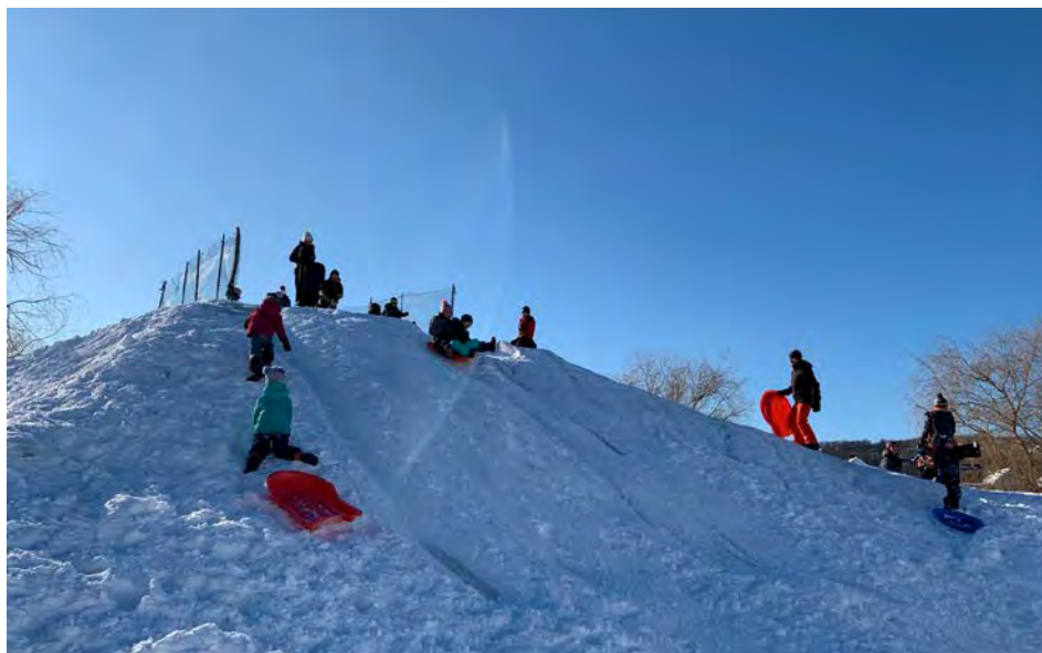
Plusieurs activités hivernales sont organisées par la Ville de Saint-Bruno.

Le dimanche 12 février, entre 10 h et 16 h, auront lieu les Olympiades hivernales, amicales et familiales, qui se tiendront aux parcs Jolliet et Bisailon. Les participants profiteront de parcours à obstacles et d'animation, tout en dégustant un bon chocolat chaud sur place.