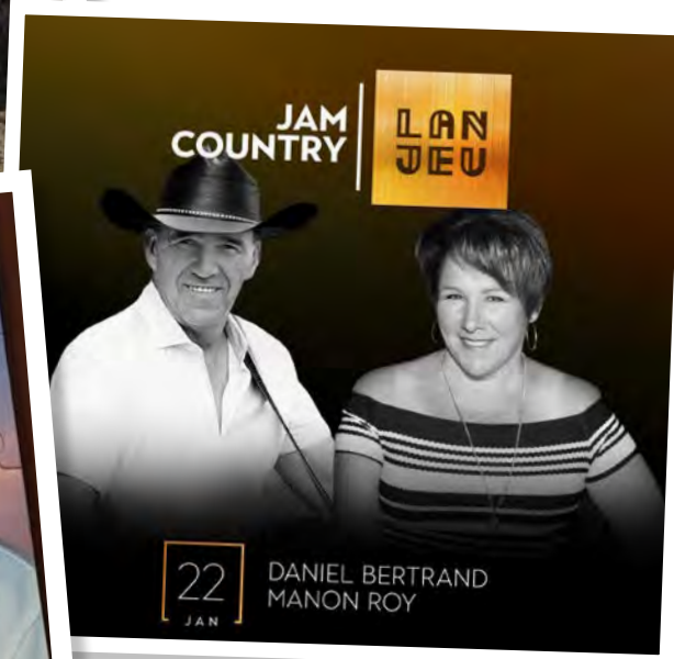
Chronique country courtoisie