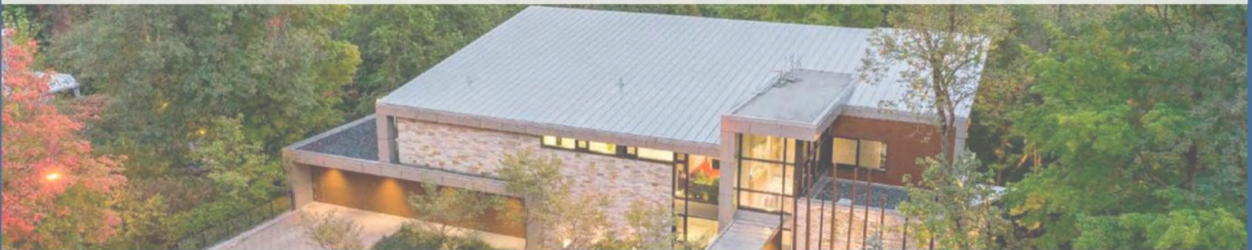
1500, DES ALOUETTES SAINT-BRUNO-DE-MONTARVILLE