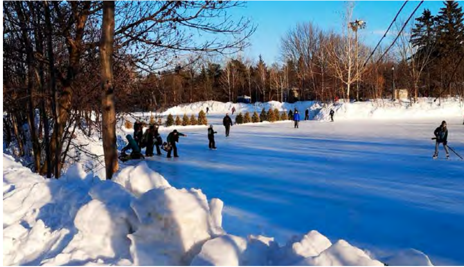
Une activité de financement pour Le Paillasson.

L'immeuble comptera 28 logements sociaux, dont 8 trois et demie, 10 quatre et demie et 10 cinq et demie. Il sera situé sur le terrain du pavillon technique. La Ville de Saint-Bruno-