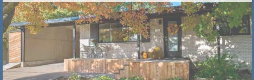
13, DES ÉRABLES SAINT-BASILE-LE-GRAND