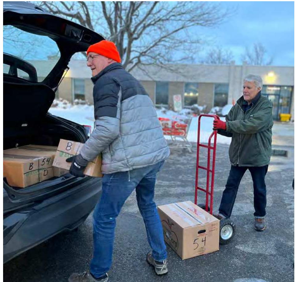
Un noyau de bénévoles revient, année après année, dans cette initiative.

En parallèle aux paniers de Noël, un autre volet est coordonné par des bénévoles de