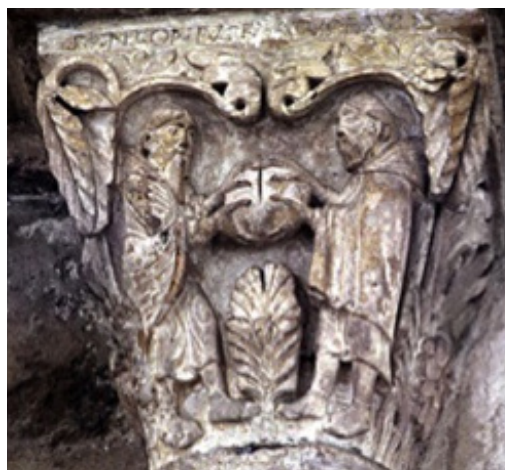
Figure 8. Saint Antoine et saint Paul, ermites. Collatéral nord, basilique Sainte-Marie-Madeleine, Vézelay, France.

Nous avons pu constater ici, que voir constitue un acte qui conduit inévitablement à mettre en relation et en cela met en jeu l'action. Parce que la vision est indissociable de l'agir, le mouvement lui est intimement lié. Aussi nous faut-il sans cesse associer voir et faire . Ces deux modalités, ici conjointes, méritent toutefois quelques éclaircissements, car si la dimension pragmatique associée volontiers à la dimension active et agissante des images semble jouer un rôle dans la question de leur efficacité 41 , il nous paraît opportun d'élargir le spectre de cette combinaison qui lie la vision et l'action.