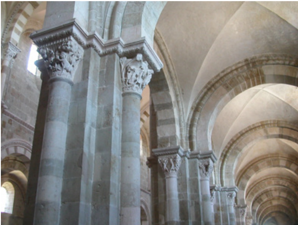
Figure 1. Animaux hybrides, lutte contre le démon qui participe à l'enlèvement de Ganymède, duel entre deux chevaliers et le démon du désespoir qui transperce son propre corps d'une épée, dans une lutte contre lui-même. Collatéral sud, circulation ouest-est, Basilique Sainte-Marie-Madeleine, Vézelay, France.

En effet, le chercheur reconstitue artificiellement une linéarité et une continuité entre les différentes faces d'un chapiteau car pour en observer l'intégralité, il faut bien sûr tourner autour. De plus, la plupart du temps, les chapiteaux montrent une suite narrative organisée autour de la face centrale, les faces latérales fournissant des compléments d'information sur le récit auquel il est fait référence 7 .