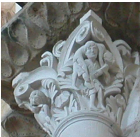
Figure 7. Pendaison de Judas (arête gauche) et dépendaison du corps de Judas (arête droite) porté tel la brebis du Bon Pasteur. Nef centrale, basilique Sainte-Marie-Madeleine, Vézelay, France.

l'un des plus grands abbés de Cluny. La théologie des miracles, dont le programme de Vézelay développe certains aspects, figurait également parmi les éléments ecclésiologiques de Pierre le Vénérable 39 , puisqu'il en fit l'un des ressorts fondamentaux qui structurent son De Miraculis (Le Livre des Merveilles de Dieu). Sans pouvoir disposer de la preuve incontestable du rôle qu'il joua à Vézelay dans l'élaboration du programme iconographique, les indices prélevés comme la volonté de conduire à la conversion tout infidèle, tout païen ; ou encore, la multiplication des évocations des Pères du désert à Vézelay, comme autant d'allusions aux conditions de l'ascèse, dont l'ordre des Chartreux qu'admirait Pierre de Montboissier constitue l'une des références majeures, conduisent néanmoins à faire de sa pensée la principale actrice qui justifie le programme iconographique 40 .