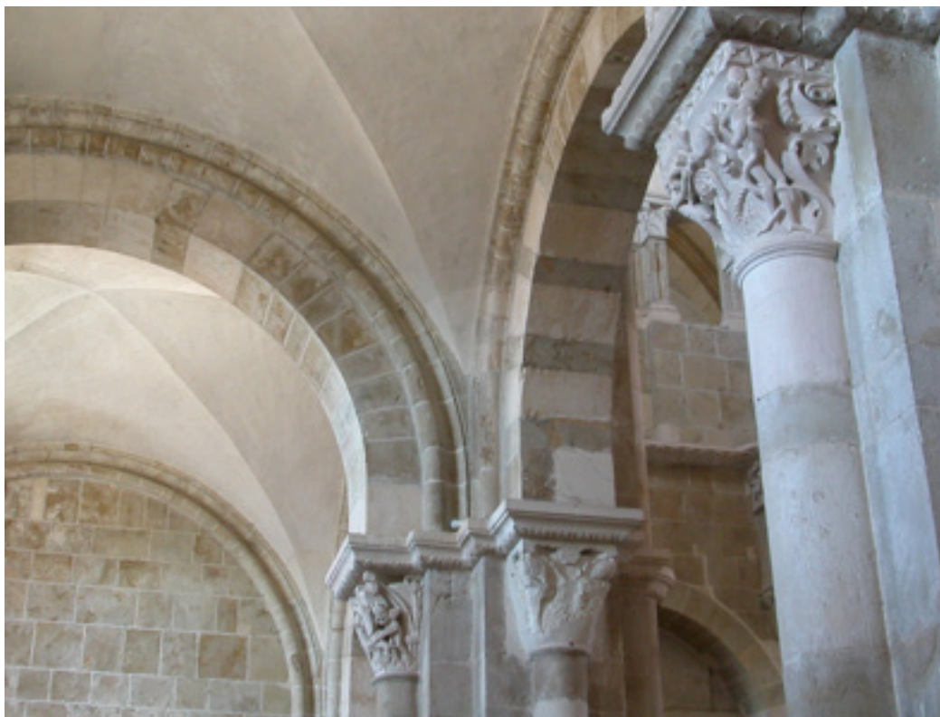
Figure 2. La Luxure, les animaux musiciens, le monstre de l'enlèvement de Ganymède. Collatéral sud, circulation est-ouest, Basilique Sainte-Marie-Madeleine, Vézelay, France.

Les deux photographies, ci-dessus rendent compte du caractère partiel des chapiteaux. La première montre un duel entre animaux hybrides et l'enlèvement de Ganymède ainsi qu'un second duel entre deux hommes vêtus de tuniques de combat chevaleresque, puis l'Orgueil ; alors que la seconde montre la Luxure, les animaux musiciens et le monstre de l'enlèvement de Ganymède. Lorsqu'on emprunte les collatéraux de l'ancienne abbatale, on constate que les chapiteaux composés de plusieurs faces, formant autant de fragments, ne donnent pas à voir les mêmes formes et sujets dans un sens ou dans l'autre. La circulation spatiale d'ouest en est montre des images différentes de celles que l'on peut voir en se déplaçant d'est en ouest. Les vidéos 2 et 4 rendent compte des différences de contenu selon que l'on emprunte le collatéral sud d'ouest en est ou d'est en ouest 8 . En effet, d'ouest en est, les faces visibles mettent en scène des animaux hybrides, des éléments narratifs relevant de la conversion de saint Eustache, ou encore des apiculteurs. Les mêmes piliers dissimulent alors dans ce sens de circulation des chapiteaux ou des faces visibles seulement dans le sens de circulation inverse : sont alors visibles d'est en ouest des éléments thématiques tels que la Justice (le Sein d'Abraham, la Balance, etc.), ou encore l'Orgueil (les animaux musiciens) et bien sûr la Luxure (vidéo 12) – là où le sens de circulation ouest-est insiste sur le Désespoir, autre figure sculptée de ce chapiteau.