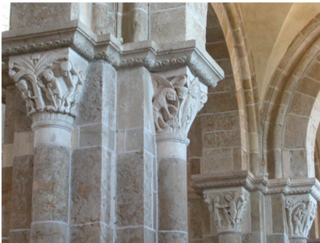
Figure 6. Le Miracle de saint Martin, Daniel dans la fosse aux lions, La Lutte de Jacob avec l'Ange et le retour d'Esau. Entrée collatérale nord, chapiteaux à feuillages présentant un traitement plastique distinct de celui des chapiteaux historiés. Basilique Sainte-Marie-Madeleine, Vézelay, France.

analogique qui forme également le soubassement de la pensée chrétienne. L'un des symptômes les plus récurrents de ce mode de construction des représentations trouve son expression dans la concordance entre l'Ancien et le Nouveau Testaments. C'est par exemple parce que Daniel est à la fosse aux lions ce que Jésus est aux limbes que l'on verra dans cette figure de prophète la préfiguration du Christ. Ainsi, le modèle analogique traverse le raisonnement théologique médiéval et structure les rapports entre les objets, entre les symboles, bref, entre toutes les formes de signes. Il en assure la fécondité mais aussi la multiplicité : car la forme analogique ne peut s'affranchir du contenu des images et assure le renouvellement de sa perception par les ressemblances de rapport qu'elle souligne. On redécouvre ainsi les contenus purement narratifs des chapiteaux en ce que certains aspects de leur teneur font l'objet d'un repérage de ressemblances de rapport.