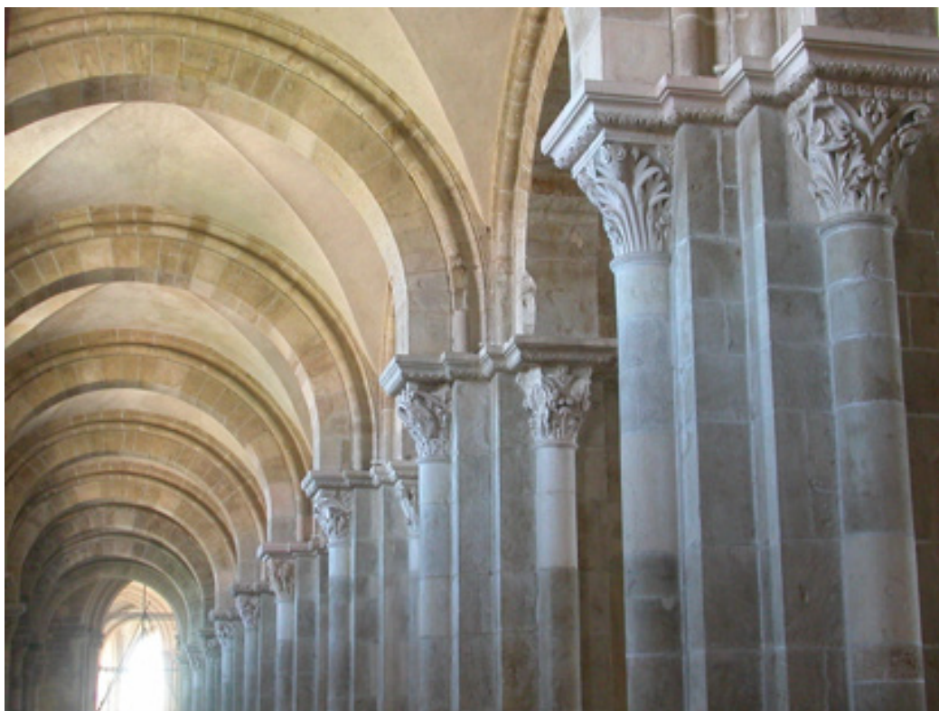
Figure 5. Entrée collatérale nord, chapiteaux à feuillages présentant un traitement plastique distinct de celui des chapiteaux historiés. Basilique Sainte-Marie-Madeleine, Vézelay, France.