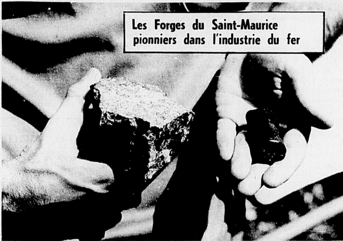
Les Forges du Saint-Maurice pionniers dans l'industrie du fer

Le capital n'a pas tous les droits, même dans une province aussi pauvre que le Québec. Il va falloir lui apprendre qu'il a aussi des responsabilités sociales envers ses employés et toute la collectivité. On lui permet d'exploiter les ressources naturelles, mais non d'exploiter tout simplement un public sans défense. Des agglomérations humaines se constituent autour des grandes industries et il vient un temps où, après de longues années de service, ces dernières leur appartiennent en partie.