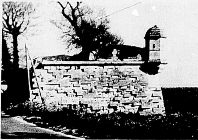
BROUAGE — Entrée de Brouage, patrie de Champlain, fondateur de Québec. Rempart et échauguette. L'ancienne porte, devenue trop étroite pour donner accès au bourg, a été démolie.