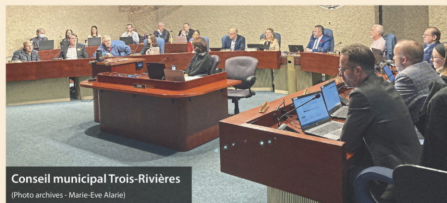
Conseil municipal Trois-Rivières

«Je pense que c'est la meilleure chose à faire dans les circonstances. On a eu un débat houleux cet après-midi. Je pense que la population en a assez de nos chicanes. Aussi, quand on révisé le code d'éthique, il est travaillé en collégialité avec l'ensemble du nouveau conseil en début de mandat. C'est le prochain conseil qui choisira d'apporter cet amendement ou non. Il y a aussi peut-être d'autres choses trop sévères