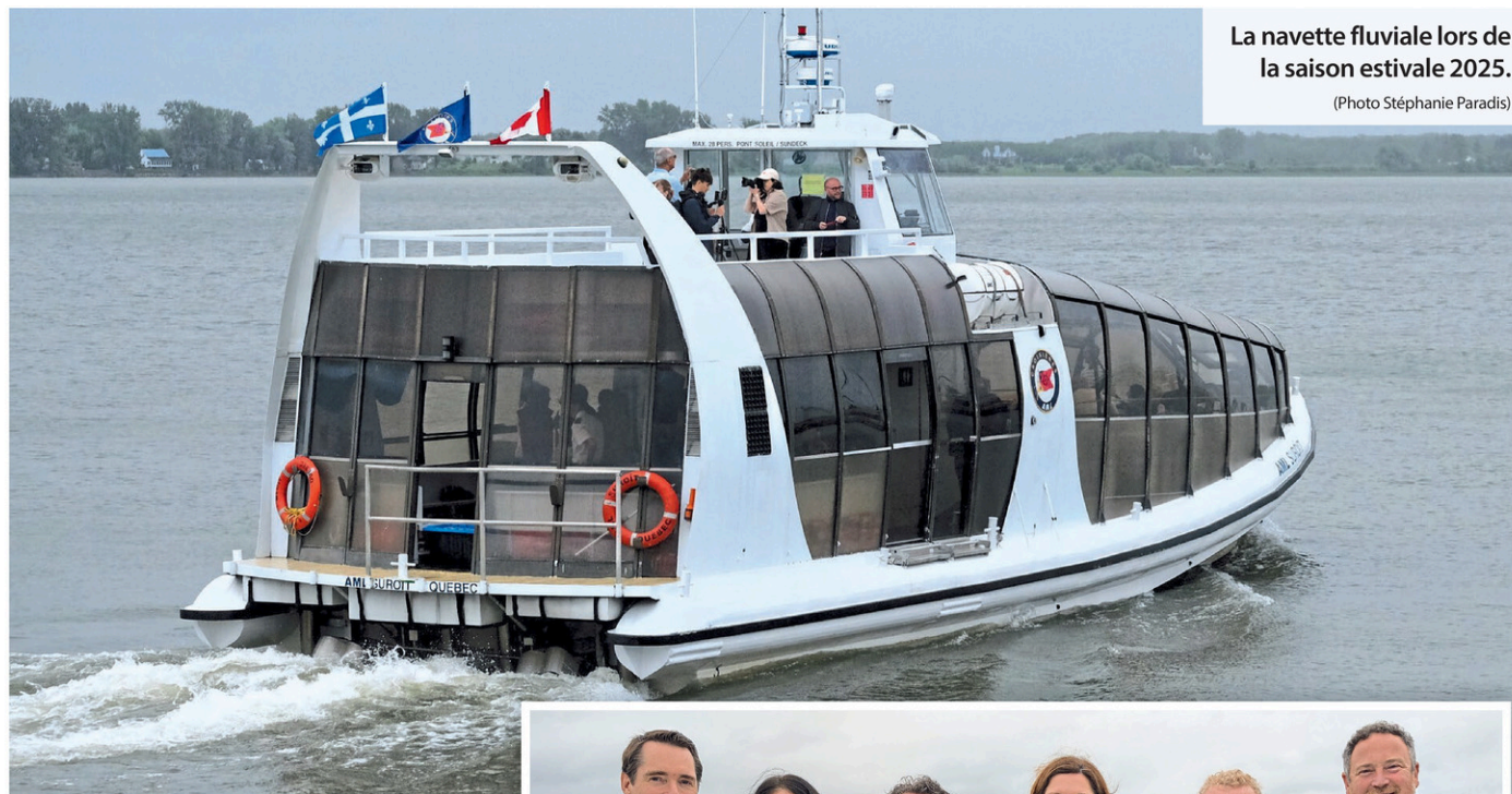
La navette fluviale lors de la saison estivale 2025.

« Le retour de la navette fluviale nous donne l'occasion de faire rayonner les beautés de Bécancour d'une façon innovante et accessible.