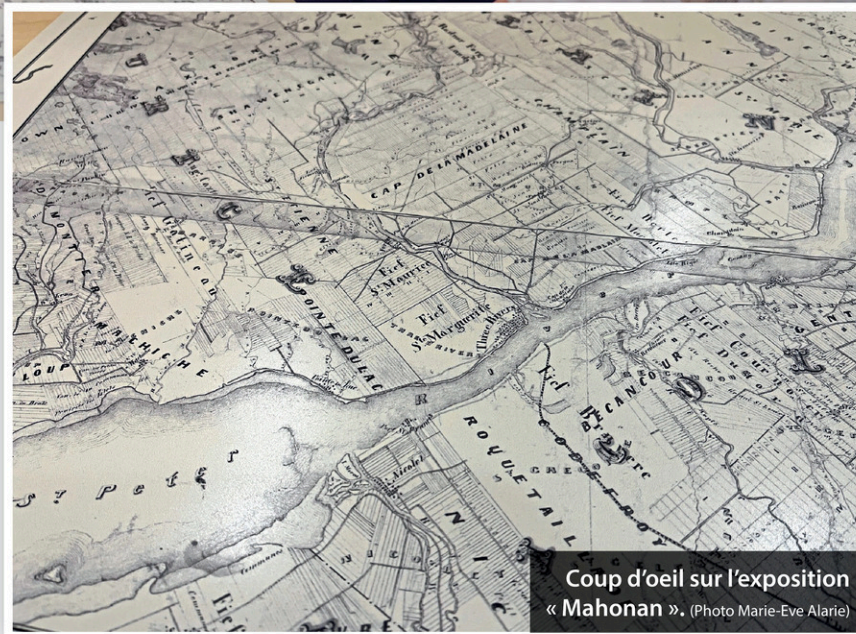
Coup d'oeil sur l'exposition « Mahonan ».

« C'est important que le public connaisse la présence des Archives nationales à Trois-Rivières, que les archives sont préservées sur place et qu'elles sont accessibles. Tout le monde peut venir faire des recherches sur leurs familles, leurs origines et l'histoire de la région », conclut