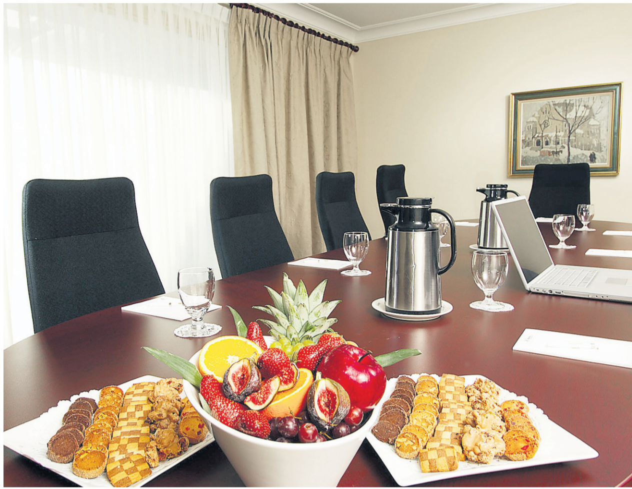
La réunionite aiguë, ça existe. Et malgré les mesures d'incitation appétissantes, on aimerait parfois s'en passer.

La communauté cybernétique regorge de spécialistes de toutes sortes. Vous avez des problèmes au bureau ? Les sites d'aide existent. Il suffit de laisser votre question sur un site et de braves gens s'empresseront d'offrir des solutions. Page 4