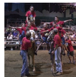
1 Zins Beauchesne et associés, septembre 2002.