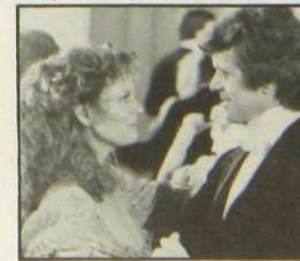
Lesley Ann Warren et Michael Sarrazin

Distribution: Lesley Ann Warren, Michael Sarrazin, Paul Rudd, Paul Shenar, Dorian Harewood, Jenny Agutter et Martha Scott. Réalisation: Virgil Vogel et Harry Falk.