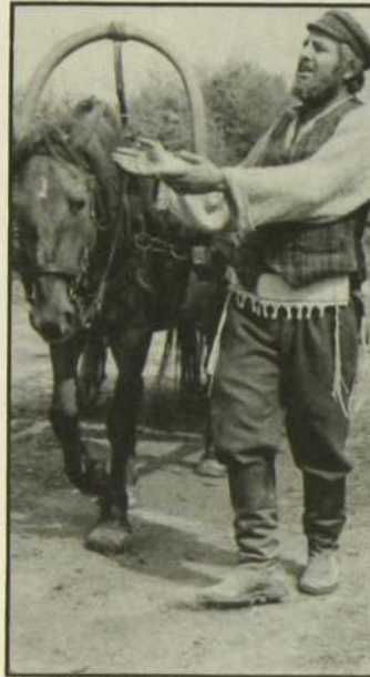
Un violon sur le toit

D'autres soucis vont accabler la petite communauté: après un