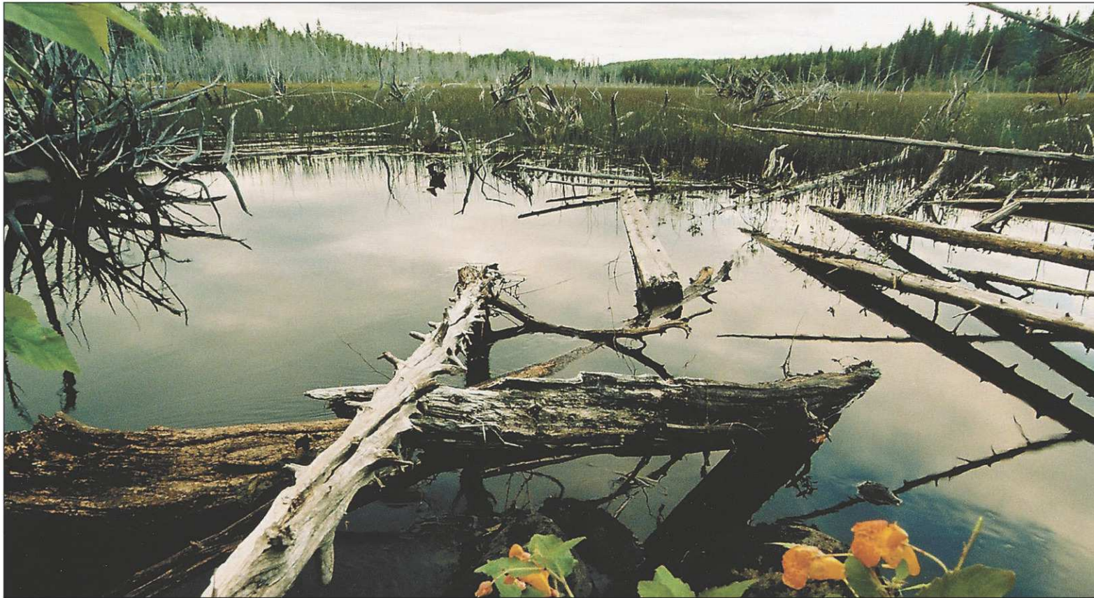
LA PRESSE, SÉBASTIEN TEMPLIER

LES GENS DU BAS-SAINT-LAURENT APPELLENT CETTE RÉGION «LE TÉMIS», EN RÉFÉRENCE À CET IMMENSE ET MAJESTUEUX PLAN D'EAU QU'EST LE LAC TÉMISCOUATA. EN EMPRUNTANT LE SENTIER INTERPROVINCIAL PETIT TÉMIS, C'EST À VÉLO QUE L'ON DÉCOUVRE RÉELLEMENT TOUS LES CHARMES ET LES ATTRAITS SOUVENT IGNORÉS DE CETTE RÉGION. UNE SUPERBE BALADE D'UN PEU PLUS DE 130 KM, QUI NOUS MÈNE DE RIVIÈRE-DU-LOUP À EDMUNSTON.