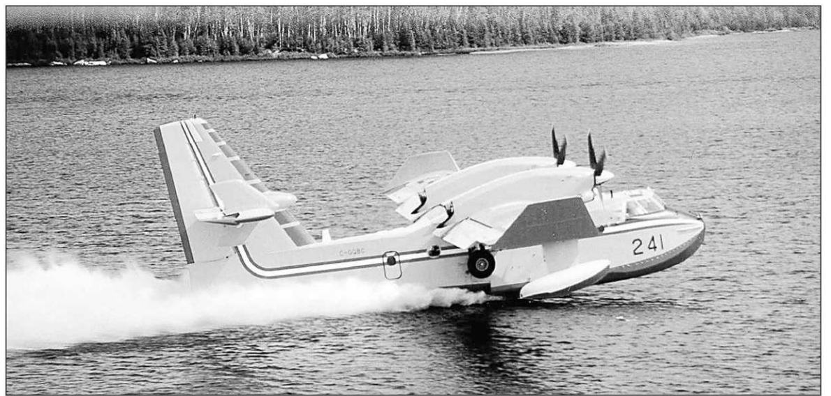
Un CL-415 effectuera une démonstration sur la rivière Saint-François à la hauteur de l'aérodrome de Drummondville, le 28 septembre prochain.

De plus, un spectacle-bénéfice sera présenté le samedi 11 octobre à 20 h. Il mettra en vedette le Collège Vocal de Laval et Gregory Charles à l'église St-Frédéric de Drummondville. Les profits serviront à acquérir un véhicule polyvalent favorisant l'accueil des personnes victimes de sinistres et permettre de prodiguer réconfort et premiers soins dans un environnement sécuritaire et adapté. Les billets, au coût de 60 $, sont disponibles sur le réseau Ovation, à la billetterie du Centre culturel ou auprès des bénévoles du SIUCQ. Les sièges sont réservés.