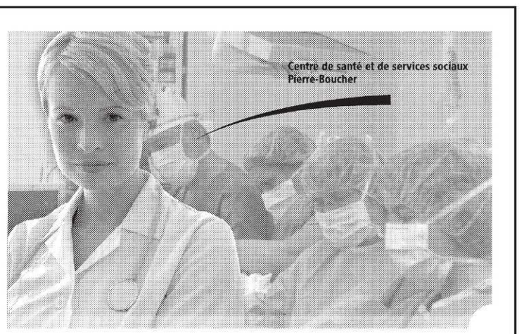
Centre de santé et de services sociaux Pierre-Boucher