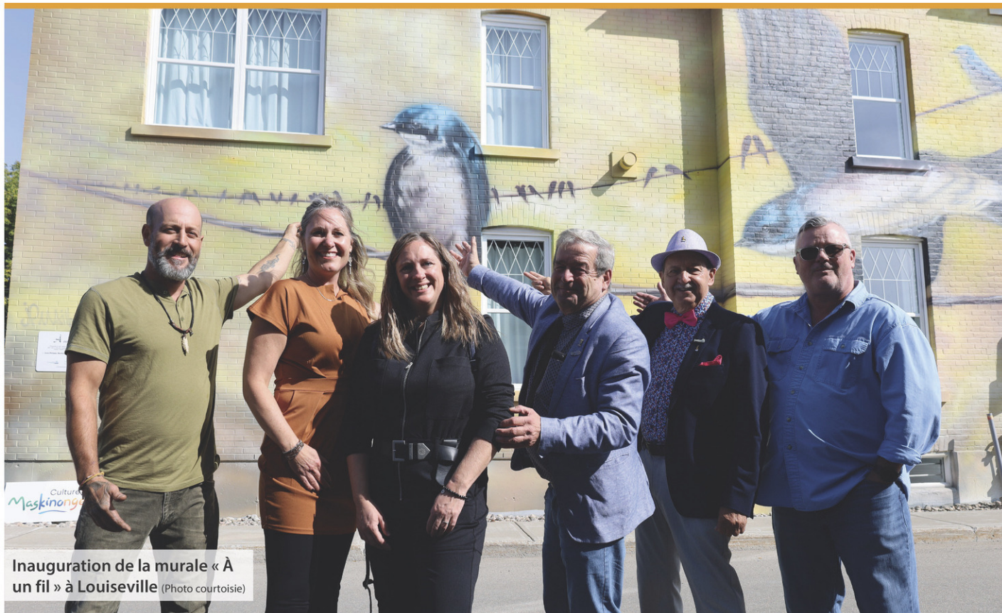
Inauguration de la murale « À un fil » à Louiseville

Renseignements : 819 228-4822 Télécopieur : 819 228-3653 Courriel : condoleances@richardphilibert.ca Site Internet : www.richardphilibert.ca Richard Maison Funéraire >9111-1