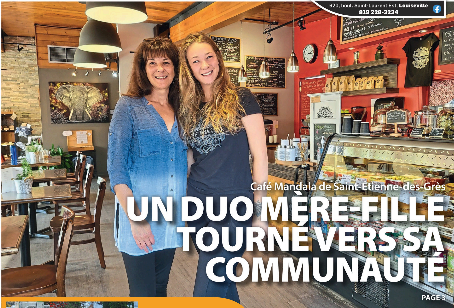
Café Mandala de Saint-Etienne-des-Grès