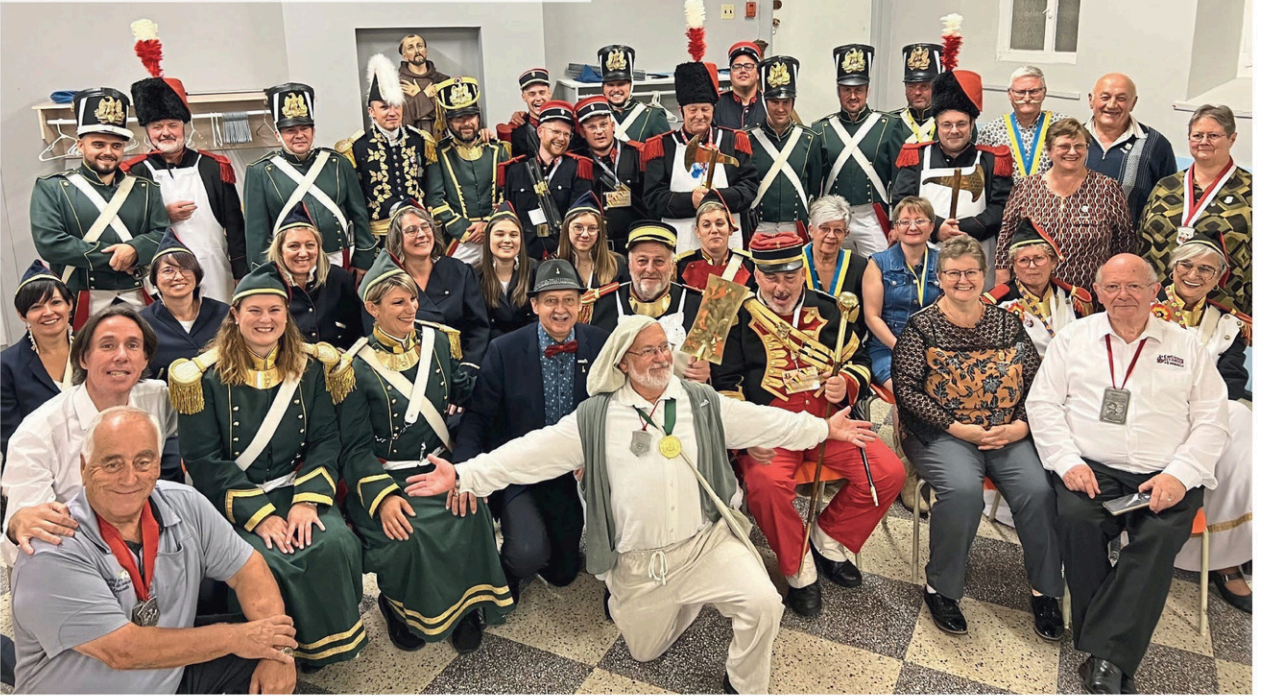
Délégation de la Belgique est de passage au Festival de la galette de sarrasin de Louiseville

« Ils sont tous logés à Saint-Élie-de-Caxton dans un grand chalet en bois ronds comme ils les aiment », poursuit Michel Ringuette.