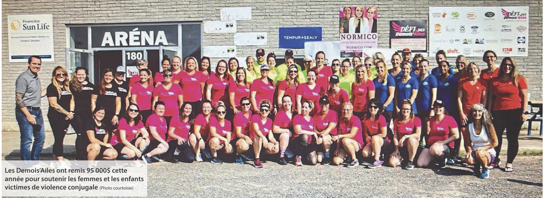
Les Demois'Ailes ont remis 95 000$ cette année pour soutenir les femmes et les enfants victimes de violence conjugale