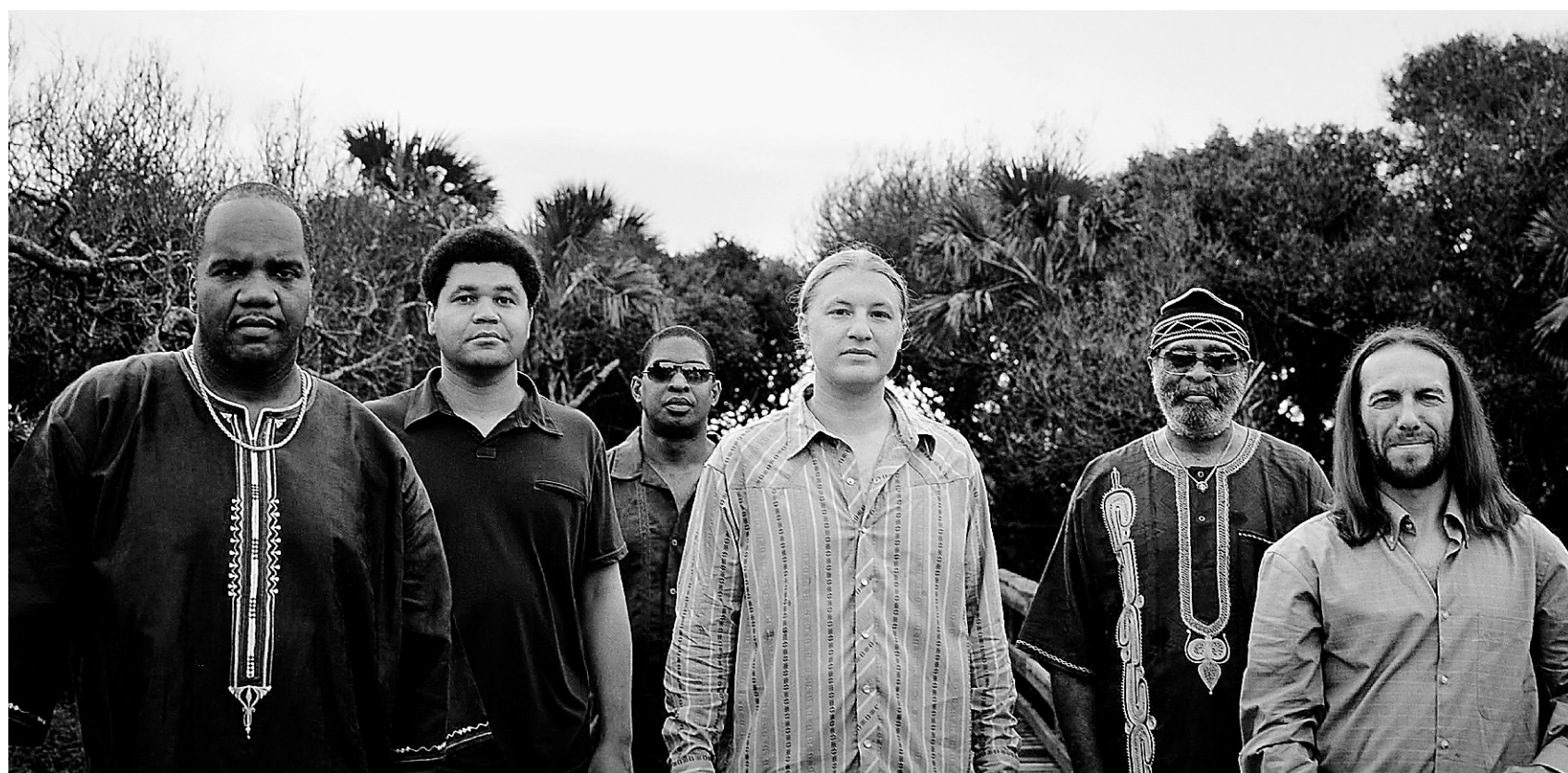
En février dernier, Derek Trucks (le blond au centre dans notre photo) se retrouvait en première page du numéro du magazine Rolling Stone consacré aux 20 nouveaux dieux de la guitare. Pas mal pour un gars qui vient d'avoir 28 ans.

Quand ils ont fait Layla à Ottawa, c'est bien simple, on aurait juré que le fantôme de Duane Allman était sur la scène. « Layla et Live at the Fillmore sont les albums que j'ai le plus écoutés quand j'avais 9 ou 10 ans et que j'apprenais à jouer, me dit Trucks qui s'amène au Spectrum ce soir avec son propre groupe. Ça m'a donc procuré toute une sensation de jouer I Am Yours, Anyday, Tell the Truth et