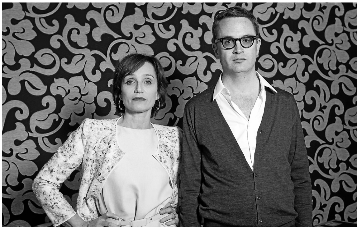
L'actrice franco-britannique Kristin Scott Thomas campe le personnage le plus intéressant du film Only God Forgives , celui de la mère de Julian, le rôle principal, interprété par Ryan Gosling. Elle pose ici aux côtés du réalisateur Nicolas Winding Refn.

Dans son thriller ultra-violent tourné à Bangkok, l'auteur cinéaste danois affiche évidemment un style incomparable, dans lequel il fait aussi valoir un sens esthétique très sûr. Mais «NWR» (comme il est de bon ton de le nommer dans les milieux branchés) a-t-il vraiment quelque chose à raconter? Rien n'est moins sûr.