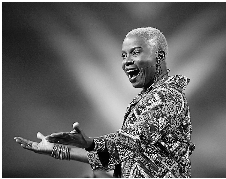
Parmi les concerts extérieurs présentés sur la scène du Quartier des spectacles dans le cadre du festival, on compte celui d'Angélique Kidjo le 19 juillet.

Au rayon découvertes, on mentionnera le concert du rappeur américain Joe Driscoll, avec le Guinéen Sékou Kouyaté. Le tandem