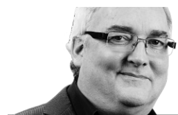
MARC-ANDRÉ LUSSIER ENVOYÉ SPÉCIAL CANNES

Poser ou auteur? Provocateur ou fumiste? À la sortie de la première projection d' Only God Forgives , les avis étaient partagés. Et très tranchés.