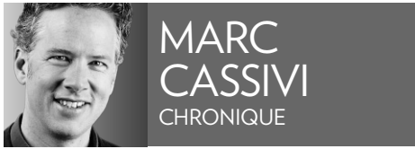
MARC CASSIVI CHRONIQUE