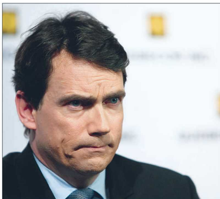
Pierre Karl Péladeau, pdg de Quebecor