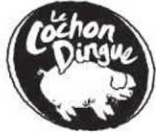
Table d'hôte santé

Dégustez un plat santé (Menu midi et table d'hôte le soir) dans un de nos restaurants et faites-vous du bien!