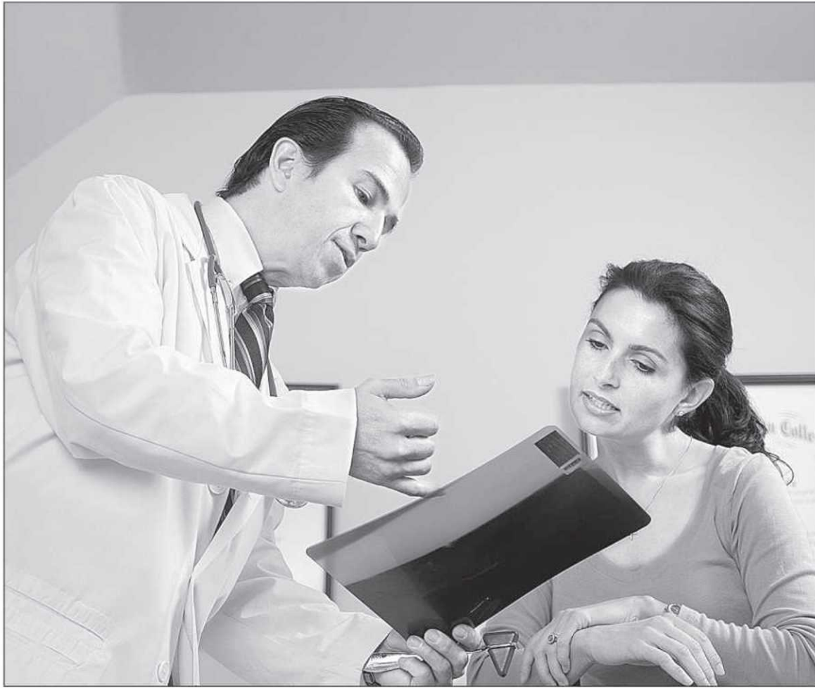
La façon de communiquer un diagnostic préoccupe tellement que le Collège des médecins offre à ses membres un atelier intitulé « Comment annoncer une mauvaise nouvelle ».