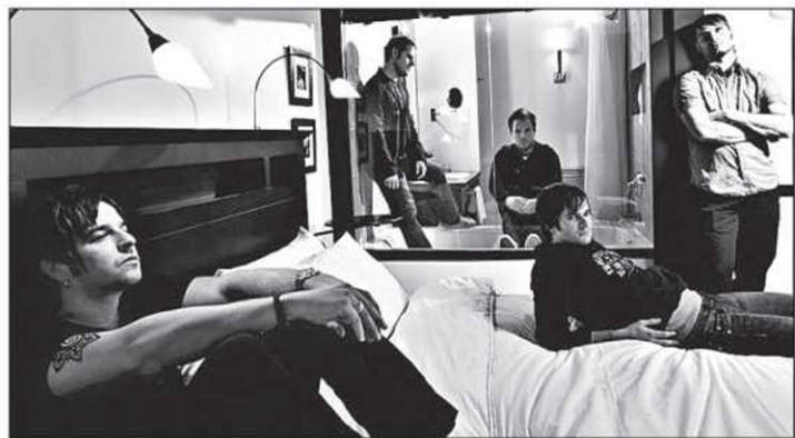
Mobile est forcé de réajuster son tir.

Déjà, plusieurs projets sont sur la table avec ce nouveau partenaire, dont la participation à une vitrine qui pourrait lui ouvrir la porte du réseau des universités américaines. Le groupe prendra également part à la grande foire indépendante South By South West de Austin, au Texas, avant que son album, Tomorrow Starts Today , ne reparaisse aux États-Unis en mai. Entre-temps, la formation effectuera une tournée du Québec qui l'amènera au Dagobert le jeudi 22 février, en compagnie des New Cities.